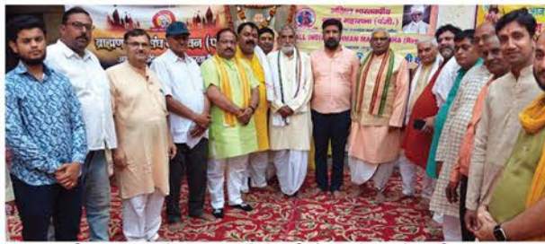
भगवान श्री परशुराम शोभायात्रा समिति की बैठक में पदाधिकारी।