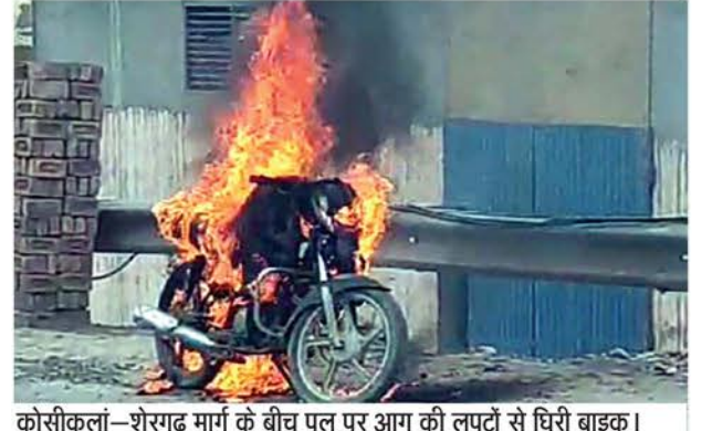
कोसीकलां-शेरगढ़ मार्ग के बीच पुल पर आग की लपटों से घिरी बाइक।