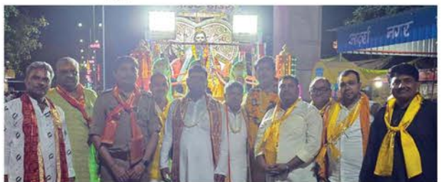
बरसाना में भगवान परशुराम की सवारी के आगे चलते ब्राह्मण महासभा के पदाधिकारी।