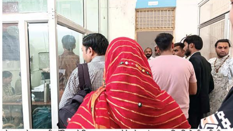
सोमवार को एसएसपी ऑफिस के शिकायत नम्बर लेने को काउंटर पर फरियादियों की लगी भीड़।