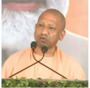
मेडिकल, एम्स, ट्रिपल आईआईटी जैसे बड़े संस्थान भी बनाने का कार्य कर रही है।