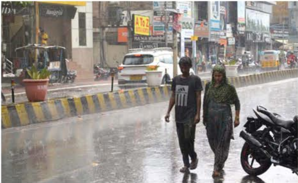
मथुरा शहर में बारिश के दौरान जाते युवक-युवती।