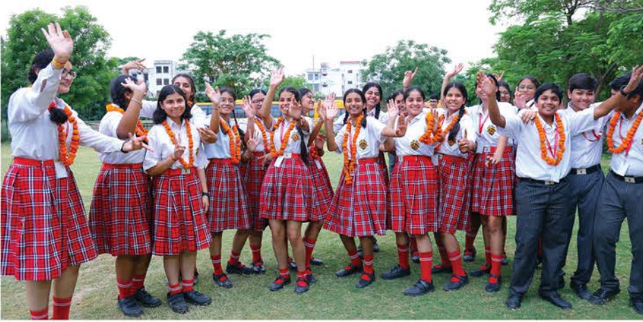
सीबीएसई इंटरमीडिएट का रिजल्ट देख कर खुशियां मनाती राजीव इंटरनेशनल स्कूल के छात्र-छात्राएं।