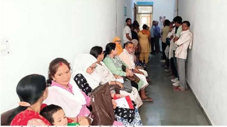
एसएसपी ऑफिस में सोमवार को लगी फरियादियों की भीड़।