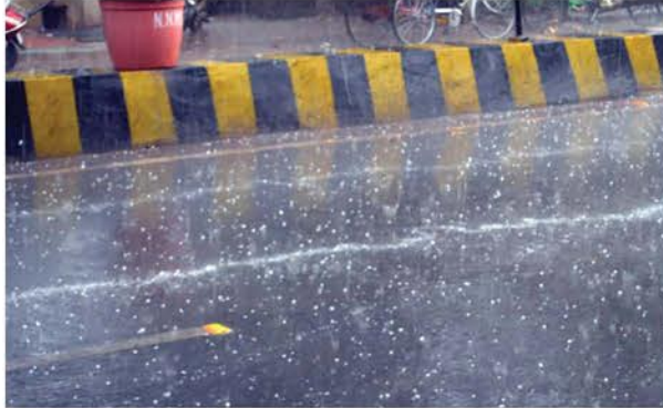
मथुरा शहर में बारिश के दौरान पड़े ओले सड़क पर बिछे हुए।