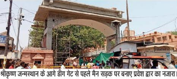
श्रीकृष्ण जन्मस्थान के आगे डींग गेट से पहले मैन सड़क पर बनाए प्रवेश द्वार का नजारा।