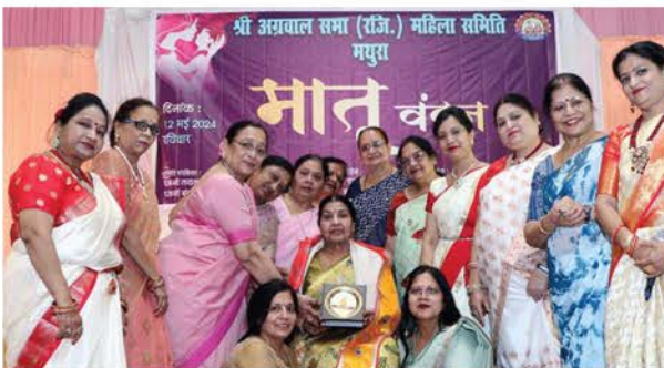
श्री अग्रवाल सभा महिला समिति के बैनर तले मातृ दिवस पर आयोजित समारोह में माता का सम्मान करती पदाधिकारी।