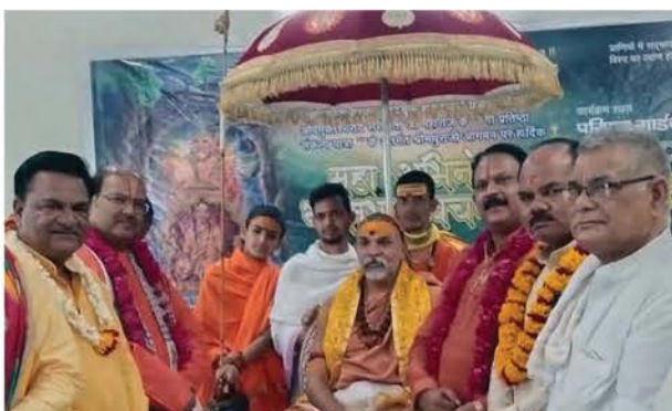
मथुरा में ज्योतिष पीठाधीश्वर जगद्गुरु शंकराचार्य स्वामी अविमुक्तेश्वरानंद सरस्वती का स्वागत करने के दौरान मथुरा के प्रबुद्ध लोग।

उन्होंने कहा उनकी यह यात्राएँ निरंतर जारी रहेंगी। अगले माह राजस्थान के विभिन्न क्षेत्रों में अलख जगाने को धर्म सभाएँ होंगी। उन्होंने चिंता व्यक्त की