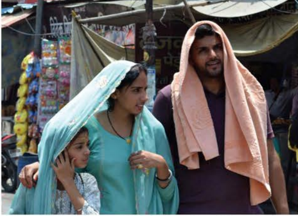
आसमान से बरसती आग से बचने के लिए एक परिवार के तीन सदस्य।