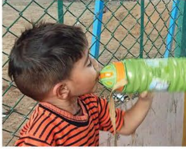
बोटल में भरे पानी से प्यास बुझाता एक बालक।

हवा के थपड़े लोगों को सहन करने पड़ रहे हैं। सरकारी बसों में लोगों को मुश्किल भरी यात्रा करने को विवश होना पड़ रहा है। यही हाल ऑटो और टैपों में यात्रा करने वालों का हो रहा है। स्कूल से घर लौटते बच्चों की वाहनों में बैठे-बैठे हालात दयनीय हो रही है। वह सोचते हैं कि कैसे जल्दी घर पहुंचें। मथुरा, वृंदावन, कोसीकलां, राया, फरह, छाता, गोवर्धन, बरसाना, नंदगांव, गोकुल और बलदेव आदि क्षेत्रों विद्युत कटौती से लोग अकुला रहे हैं। शिकायत करने पर विद्युत सब स्टेशनों पर फोन उठाने से कर्मचारी