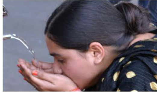
शहर में एक प्याऊ से पानी पीती एक महिला।