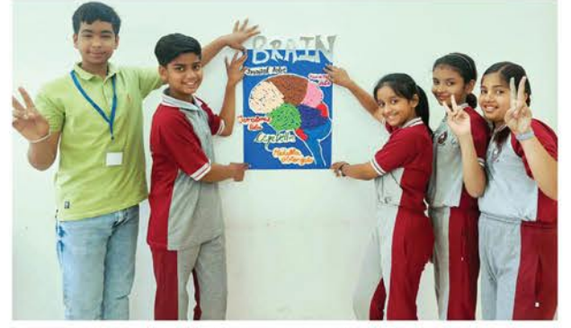
वृन्दावन स्थित द सारंग हाई इम्पेक्ट स्कूल में एक पोस्टर को चर्चा करते स्टूडेंट्स।