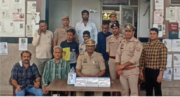
जीआरपी की गिरफ्त में तीन चोरों के बारे में जानकारी देते अधिकारी।