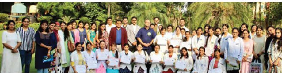
दो दिवसीय कार्यशाला के समापन पर अतिथियों के साथ प्रतिभागी।