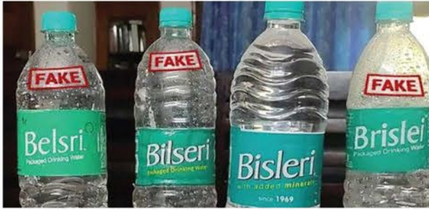
पानी की बोतलों को लेकर सोशल मीडिया पर जारी तस्वीर।

इन दिनों में पानी की बोतल दुकानों पर दिखाई पड़ जाएंगी। इसमें खासकर बिसलेरी जैसे नामी ब्रांड की बोतल को लेकर लोग असमंजस की स्थिति में फंस जाते हैं। इन दिनों बिसलेरी जैसी दिखने वाली नकली पानी की बोतल काफी संख्या में बाजार के बीच