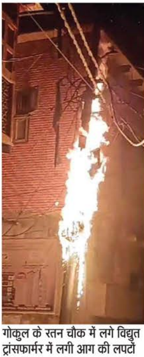
गोकुल के रतन चौक में लगे विद्युत ट्रांसफार्मर में लगी आग की लपटों का नजारा।