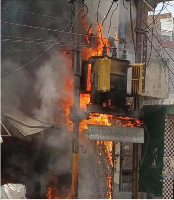
कोसीकलां में कस्बा पुलिस चौकी के पास रखे ट्रांसफार्मर में लगी आग का नजारा।