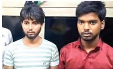
ठाकुर बांकेबिहारी मंदिर में पकड़े संदिग्ध दो युवक पुलिस की गिरफ्त में।

पहले लखनऊ की रहने वाली हिन्दू युवती से हुई थी। यह युवती लगातार ठाकुर बांके बिहारी मंदिर दर्शन करने आती हैं। युवक के अनुसार बातचीत में युवती ने उससे कहा कि पहले वह ठाकुर बांके बिहारी महाराज के दर्शन करने जाए। इंतजार के अनुसार युवती के कहने पर वह अपने साथी राजा