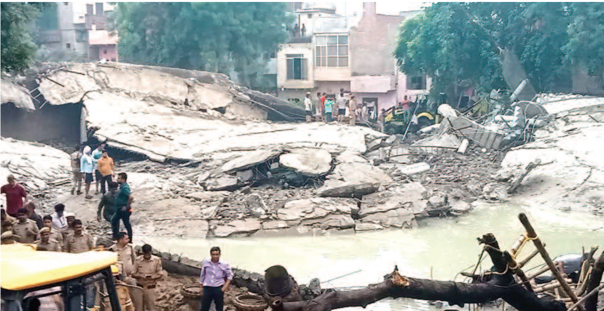
कृष्णा विहार कॉलोनी में भरभरा कर गिरी पानी की टंकी का मलबा प्रमुख संवाददाता