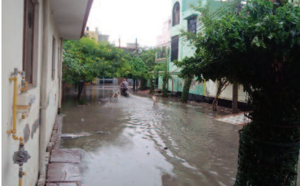
बारिश के बाद वृंदावन में जल भराव का नजारा।