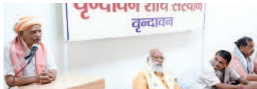
वृंदावन शोध संस्थान में आयोजित संगोष्ठी को संबोधित करते अतिथि।