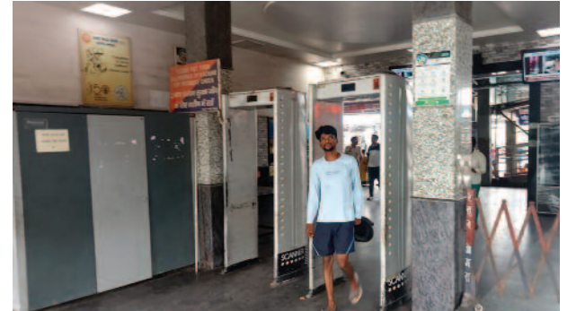
मथुरा जंक्शन के मुख्य एंट्री गेट पर खराब पड़ी तीनों मेटल डिटेक्टर मशीन।