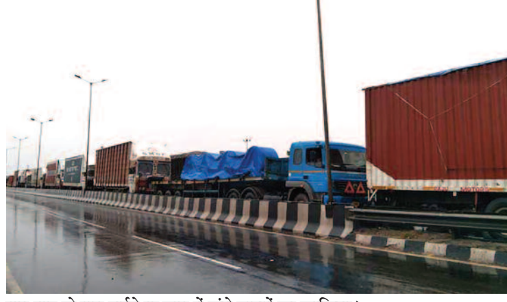
सर्विस रोड पर सड़क खराब होने पर दल दल में फंसा ट्रक।