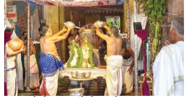
उत्तर भारत के प्रसिद्ध रंगनाथ मंदिर में ठाकुर गोदारंगमन्नार भगवान का ज्येष्ठाभिषेक करते सेवायत।