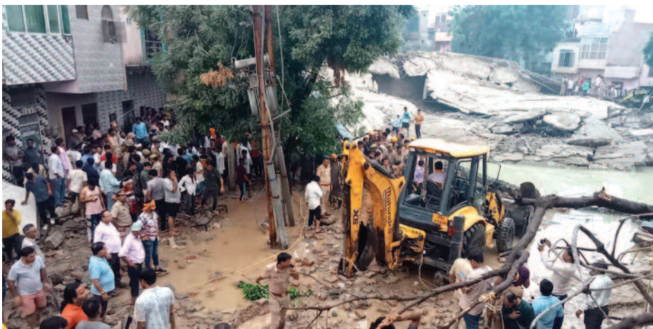
कृष्णा विहार कॉलोनी में मलबे को हटाती जेसीबी।

नहीं लगी। टंकी का पानी घरों के अंदर हिलोरे मारते हुए घुस गया। आशंका जाहिर की गई है कि कई लोग मलबे में दब गए हैं। लोगों का कहना है कि इस टंकी से पानी निरंतर टपकता रहता था। कर्मचारी आते थे और टपकते