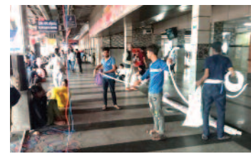
मथुरा जंक्शन के प्लेटफॉर्म पर विजली व्यवस्था सुधारने के लिए लाइन विछाने कर्मचारी।

अधिकारी ने प्रयास नहीं किए। न ही रेलवे पुलिस ने कोई कार्यवाही की है।