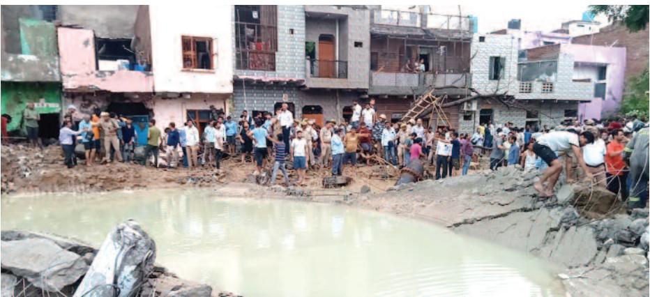
कृष्णा विहार कॉलोनी में टंकी गिरने के बाद मौके पर पहुंचे स्थानीय लोग।