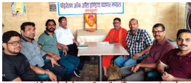
भामाशाह जयंती मनाते फेडरेशन ऑफ ऑल इंडिया व्यापार मंडल के पदाधिकारी।