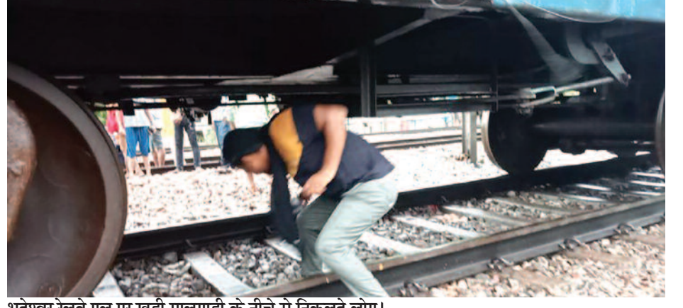
भूतेश्वर रेलवे पुल पर खड़ी मालगाड़ी के नीचे से निकलते लोग।