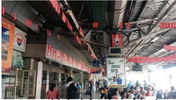
मथुरा जंक्शन पर नार्दन रेलवे कर्मचारी संघ के चुनाव के बैनर, पोस्टर व झंडिया लगी हुई।