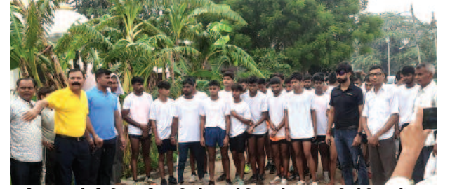
शहीद राजा देवी सिंह की स्मृति में आयोजित खेलकूद प्रतियोगिता में भाग लेने वाले खिलाड़ी।