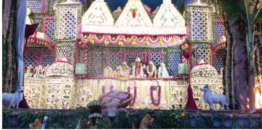
वृंदावन स्थित उत्तर भारत के प्रसिद्ध श्री रंगनाथ मंदिर में सजाए फूल बंगला में विराजित ठाकुर गोदासंगमनार की दिव्याकर्षक छवि को निहारने के लिए श्रद्धालुओं का सैलाब उमड़ पड़ा।