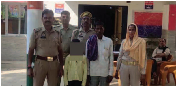
बच्चे को पिता के सुपुर्द करती सुरीर पुलिस।