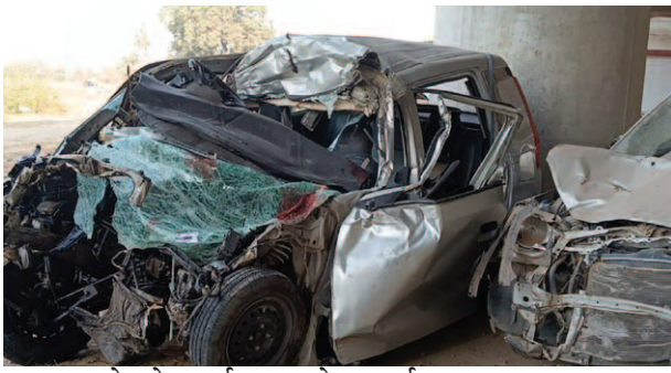
यमुना एक्सप्रेस वे पर हुई टक्कर के बाद दुर्घटनाग्रस्त कार।

जानकारी के अनुसार आगरा से दिल्ली जा रही बेंगलूर कार अनियंत्रित होकर सड़क पर खड़े अज्ञात वाहन में घुस गई। जहां से गाड़ी नेम प्लेट टूटी मिली है। कार में पांच लोग सवार थे। इस हादसे में तीन लोगों ने मौके पर दम तोड़ दिया। दो लोग गंभीर रूप से घायल हो गए। इनकी हालात भी चिंताजनक