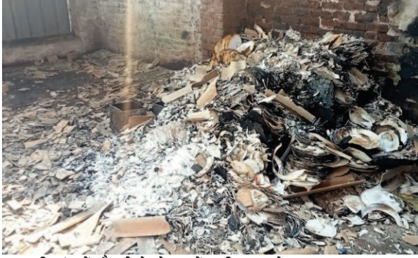
सरस्वती कुंड में कैटर्स के गोदाम में लगी आग के बाद का नजारा।