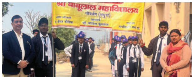
स्वच्छता की अलख जगाते राष्ट्रीय सेवा योजना के विद्यार्थी।

संवाददाता यूनिक समय, गोवर्धन। श्री बाबू लाल महाविद्यालय की राष्ट्रीय सेवा योजना की इकाई का द्वितीय एक दिवसीय शिविर नंदगांव स्थित आशेश्वर महादेव पर लगाया गया। आशेश्वर महादेव के समीप स्थित जलाशय के घाटों की सफाई की गई तथा वहां जमी हुई मिट्टी को फावड़े और तसलों की सहायता से दूर हटाया गया। साथ ही विद्यार्थियों ने नंद भवन के दर्शन भी किया। विद्यार्थियों को महाविद्यालय से भेजते समय प्राचार्य