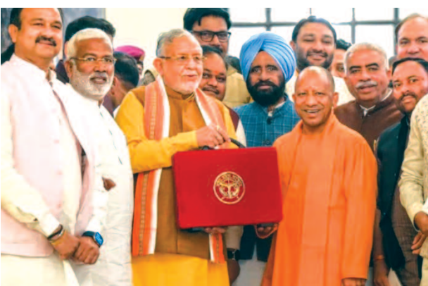
विधानसभा में बजट पेश करते वित्त मंत्री सुरेश खन्ना। साथ ही सीएम योगी आदित्यनाथ।

यूनिक्क समय, लखनऊ। मुख्यमंत्री योगी आदित्यनाथ की अगुवाई वाली सरकार के वित्त मंत्री सुरेश खन्ना ने आज विधानसभा में बजट 2026-27 पेश किया। बजट में मथुरा-वृंदावन के विकास के लिए बड़ा ऐलान किया गया। धार्मिक नगरी को