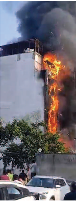
होटल के बाहरी हिस्से में दिखाई दे रही आग की लपटों का नजारा।