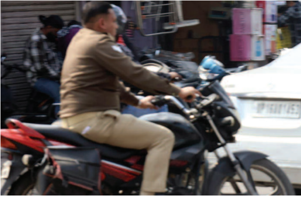
बिला हेलमेट लगाए बाइक सवार पुलिसकर्मी।