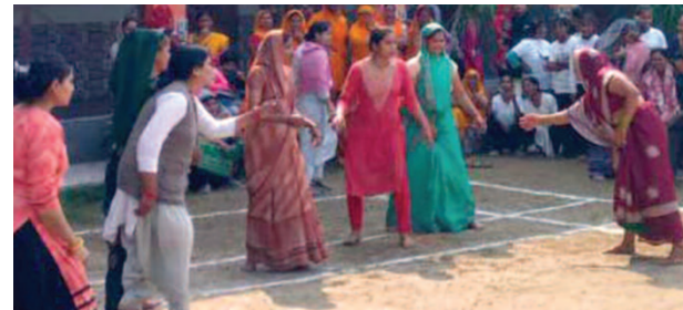
बुधवार को दीनदयाल धाम में आयोजित प्रतियोगिता के दौरान कबड्डी खेलती महिलाएं।

संवाददाता यूनिक समय, फरह (मथुरा)। बुधवार को दीनदयाल धाम में आयोजित खेलकूद प्रतियोगिता के दौरान धोती पहन कर उतरी महिलाएं आकर्षक का केंद्र बनीं रहीं। खो-खो, कबड्डी और अन्य प्रतियोगिताओं में साड़ी और धोती पहनकर मैदान में उतरी महिलाओं ने बाजी मारी।