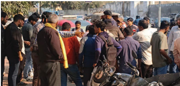
एक्सिडेंट के बाद घटनास्थल पर एकत्रित लोगों की भीड़ का नजारा।