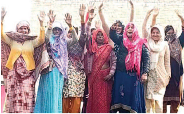
कोसीकलां के पवन कुंज कॉलोनी में प्रदर्शन करती महिलाएं।

संवाददाता यूनिक समय, कोसीकलां। नगर के बटैन गेट इलाके में बसी पवन कुंज कॉलोनी में समस्याओं से त्रस्त लोगों ने प्रदर्शन करते हुए जिला प्रशासन से समस्याओं से निजात दिलाने की मांग की है। बटैनगेट इलाके स्थित पवन