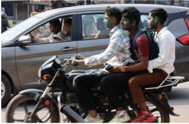
बिना हेलमेट लगाए बाइकों पर तीन-तीन सवारी।