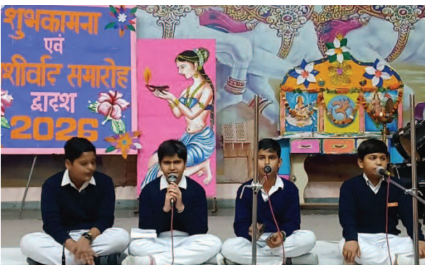
श्रीजी बाबा सरस्वती विद्या मंदिर में कक्षा द्वादश के विद्यार्थियों के विदाई समारोह में प्रस्तुति देते भैया।