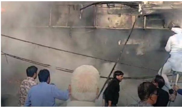
वृंदावन में रुकमणि विहार स्थित निर्माणाधीन होटल में लगी आग से उठते धुएं का गुबार।

यूनिक्क समय, वृंदावन। रुकमणि विहार कॉलोनी स्थित एक होटल में भीषण आग लगने से अफरा तफरी मच गई। आग के काले धुएं के गुबार दूर से ही दिखाई देने लगे। आग की खबर से होटल के अंदर चल रहे कार्यक्रम में भगदड़ सी मच गई। इलाके के लोगों ने बचाव कार्य शुरू कर दिया। सूचना पर पहुंचे दमकलकर्मियों ने