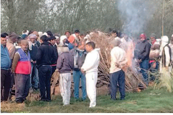
ग्राम पंचायत जचौदा के मजरा ग्राम रामनगर में श्मशान घाट पर खड़ी ग्रामीण।