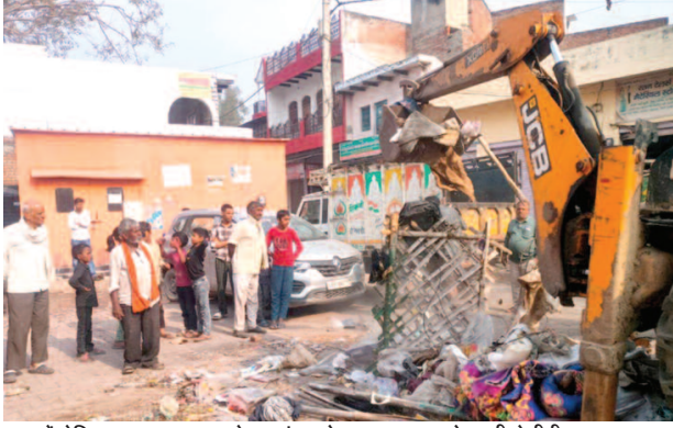
फरह में होलिका दहन स्थल पर रखे गए बांस समेत अन्य सामान को हटाती जेसीबी।

बसंत पंचमी पर पथवारी मंदिर चौक परिसर में होली का डांडा गाढ़ा गया था। डांडे को परिसर में जबरन वाहन खड़े करने वालों ने नष्ट कर दिया। इसके बाद आसपास के लोग होलिका स्थल पर घरों का कचरा, पुराने कपड़े और बांस आदि रख दिए थे। स्थानीय लोगों ने परिसर में वाहन खड़े करने की