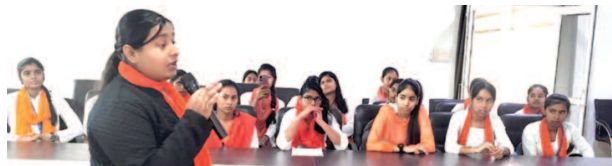
विज्ञान दिवस पर आयोजित प्रतियोगिता में भाषण देती छात्रा।