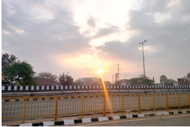
शनिवार सुबह आसमान में छाए बादलों के बीच छिया सूरज।

सुबह-सुबह अचानक मौसम बदला तो हल्की बूदाबांदी हो गई। सुबह ऐसा दो बार हुआ। इसके बाद आसमान पर बादल छाए रहे। शाम तक यह काले बादल फसल कटाई में जुटे किसानों को डराते रहे। वैसे, सुबह से शाम तक धूप भी खिली। दोपहर में मौसम का मिजाज गर्म होने से लोग बूदाबांदी की आशंका जताते रहे। मौसम के ऐसे हाल को