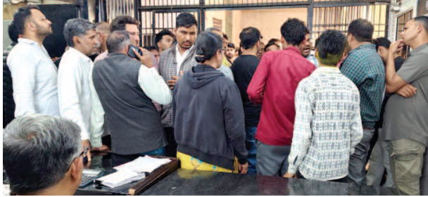
छाता रजिस्ट्री कार्यालय में लोगों की भीड़।

यूनिक समय, छाता (मथुरा)। सब-रजिस्ट्री कार्यालय में इन दिनों जमीनों के बैनमे और रजिस्ट्री कराने वालों का तांता लगा हुआ है। होली से पहले शनिवार को कार्यालय में बढ़ती भीड़ और धीमी प्रक्रिया के चलते लोगों को घंटों इंतजार करना पड़ा है। मिली जानकारी के अनुसार, शनिवार को शाम 5:00 बजे तक 98 रजिस्ट्री ही हो पाई। पांच बजे से 1 घंटा समय बढ़ाया गया जो कि 6:00 तक चला फिर भी रजिस्ट्री नहीं हो पाई और रजिस्ट्री करने वाले लोग बिना रजिस्ट्री कराए लौटे। रजिस्ट्री कराने वालों की संख्या में अचानक भारी उछाल आया है। शुक्रवार को 184 टोकन जनरेट हुए। शनिवार को स्थिति ऐसी ही रही। बैनमा कराने आए लोग सुबह 9:00 से शाम तक दफ्तर में बैठे रहे। लोग टोकन लेने और अपनी बारी का आने का इंतजार करते थक