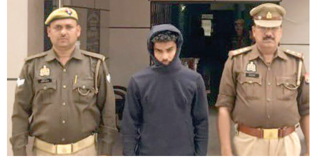
पुलिस की गिरफ्त में हत्या आरोपी।