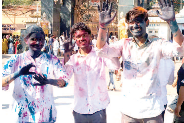
होली खेलते छात्र।