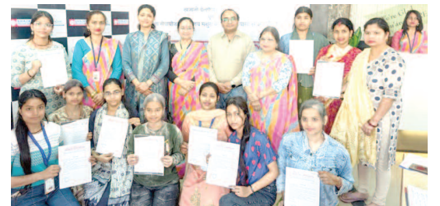
ब्रज कला केंद्र में आयोजित रोजगार मेला में चयनित प्रतिभागी अतिथियों के साथ।

यूनिक समय, मथुरा। खजानी वेलफेयर सोसाइटी एवं जिला सेवायोजन विभाग के संयुक्त प्रयासों से ब्रज कला केंद्र में रोजगार मेला लगाया। इसमें बुटीक, टेलरिंग, कंप्यूटर, ऑटोमोबाइल एवं अन्य कौशल आधारित क्षेत्रों से जुड़ी विभिन्न कंपनियों ने सहभागिता की। कार्यक्रम में लगभग 150 से अधिक विद्यार्थियों एवं प्रतिभागियों ने भाग लिया। साथ ही, उद्यमिता जागरूकता अभियान भी आयोजित किया। मेला की प्रमुख उपलब्धि यह रही कि कुल 77 प्रतिभागियों का चयन किया। जिन्हें कंप्यूटर, फैशन डिजाइनिंग (बुटीक) एवं अन्य संबंधित क्षेत्रों में