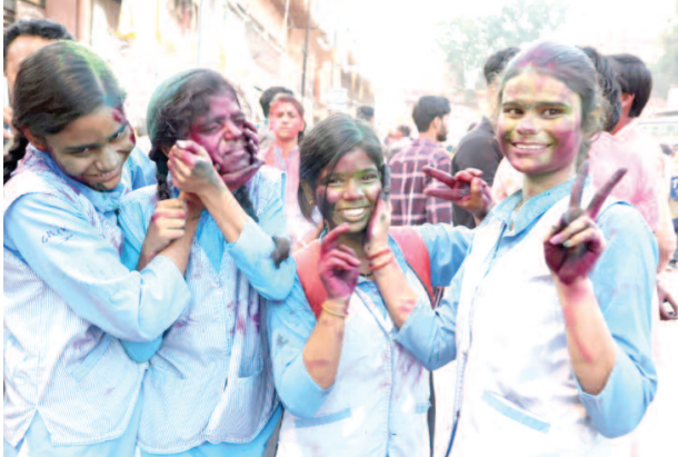
मथुरा में एक दूसरे के रंग लगाती छात्राएं।