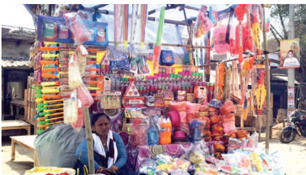
मथुरा के बाजार में पिचकारी और रंग की सजी दुकान।