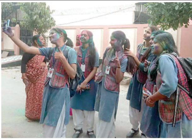
वृंदावन में होली खेलने के बाद अपनी सहेली छात्राओं के साथ सेल्फी लेती एक छात्रा।

यूनिक समय, मथुरा। शनिवार को स्कूल और कॉलेज में होली खेली गई छात्र-छात्राओं ने एक दूसरे को अबीर गुलाल और रंग लगाया। होली खेलने के बाद छुट्टी हो गई तो छात्र-छात्राएं रंग बिरंगे होकर घरों को लौटे। उनका बदरंग चेहरा देखकर हर किसी के मुंह से निकला हैप्पी होली। होली भले ही चार मार्च को खेली जाएगी, लेकिन स्कूल-कॉलेजों में होली का असर शनिवार को देखा गया। सभी को मालूम था कि आज स्कूल-कॉलेजों में होली खेली जाएगी, अधिकांश छात्र-छात्राएं तैयारी करके पहुंचे थे। जैसे ही शिक्षकों की