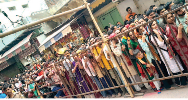
ठाकुर बांके बिहारी मंदिर में दर्शन करने के लिए लाइन में लगे श्रद्धालुओं का नजारा।