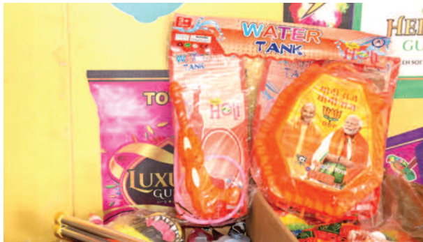
मोदी और योगी की आई पिचकारी।

सिलेंडर की डिजाइन वाली पिचकारियां बच्चों और युवाओं को खूब पसंद आ रही हैं। दुकानदारों ने बताया कि इन पिचकारियों की मांग पिछले वर्ष की तुलना में अधिक है।