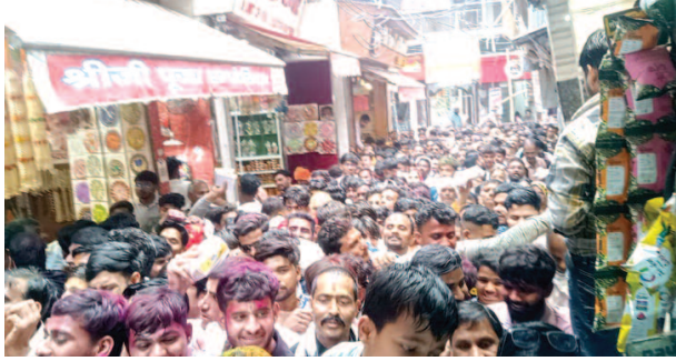
ठाकुर बांके बिहारी मंदिर में दर्शन का इंतजार करती श्रद्धालुओं की भीड़।