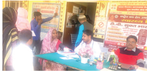
टीबी शिविर में उपस्थित स्वास्थ्य विभाग के अधिकारी।

शासन के निर्देश पर जिले के ग्रामीण और शहरी क्षेत्रों में लगाए सौ टीबी शिविरों में स्वास्थ्य विभाग की टीमों ने 4568 महिला, पुरुष और युवाओं की जांच की। इसमें लक्षणों के आधार पर 276 लोगों को संभावित टीबी मरीज के रूप में चिन्हित किया गया। इन सभी की बलगम जांच नॉट मशीन से कराई गई। जांच के बाद 38 मरीजों में टीबी की पुष्टि हुई। सभी मरीजों का उपचार तुरंत शुरू कर दिया