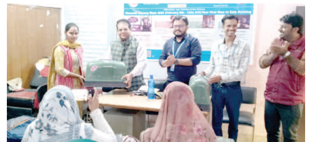
महिलाओं को सिलाई मशीन वितरित करते केनरा बैंक के अधिकारी।