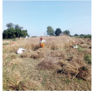
शनिवार सुबह आसमान में छाए बादलों के बीच गेहूं फसल काटते मजदूर।

यूनिक समय, फरह (मथुरा)। मौसम में बदलाव गेहूं फसल पर भारी पड़ सकता है। पूर्व में कई बार और अब बीती रात शुक्रवार को सक्रिय पश्चिमी विक्षोभ के चलते हुई जोरदार वर्षा से गेहूं के उत्पादन पर असर पड़ सकता है। कृषि वैज्ञानिक बे मौसम वर्षा की वजह से गेहूं के दानों की चमक फीकी पड़ने की संभावना जता रहे हैं। वहीं, खराब मौसम की वजह से किसानों ने गेहूं कुटाई का काम रोक दिया है। मार्च के बाद अब अप्रैल में खराब हो रहे मौसम से गेहूं के दानों की चमक के फीकी पड़ने की संभावना जताई जा रही है। वहीं, बारिश से एक दिन कटाई व मंडाई का काम बाधित हो गया। शुक्रवार देर रात बादलों की गर्जना, तेज हवा के झोंकों के साथ हल्की बारिश