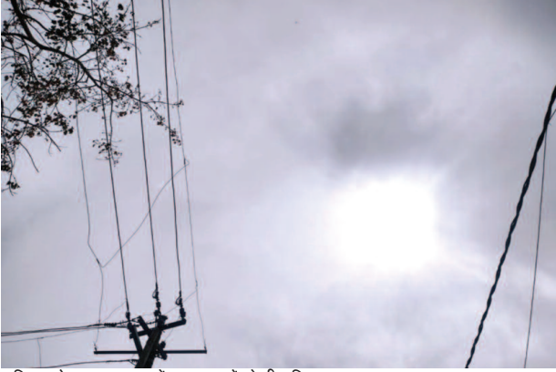
शनिवार दोपहर आसमान में छाए बादलों के बीच छिपा सूरज।