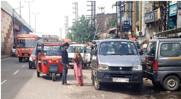
गोवर्धन चौराहे पर सड़क पर सफेद पट्टी के बाहर खड़े वाहन जो बनते हैं जाम की बड़ी वजह।

शहर की सड़कों पर फिर से जाम लगने के हालात पैदा हो रहे हैं। सड़क पर नो पार्किंग जोन होने के बाद भी वाहन चलाने वाले अपने वाहनों को बेतरतीब से पार्क कर रहे हैं जिसके चलते सड़क से गुजरने वाले वाहनों की ऐसे स्थानों पर लाइन लग रही है। ट्रैफिक पुलिस द्वारा पूर्व में नो पार्किंग जोन में खड़े मिलने वाले वाहनों के पहियों को लॉक कर दिया जाता था। वाहन स्वामी