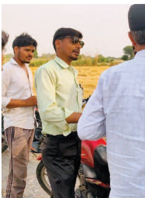
चश्मा लगाए विकास एवं टोपी लगाए लेखपाल।

छुट्टी थी। दोपहर करीब तीन बजे एक किसान के खेत में कम्बाइन हार्वेस्टर फसल काट रही थी। ड्राइवर की लापरवाही के कारण खेत से बाहर निकलते समय हार्वेस्टर हाई-वोल्टेज विद्युत लाइन से टकरा गई। तार आपस में टकराए, भयंकर स्पाकिंग हुई और चिंगारियां खेत में बचे पुआल पर गिर पड़ीं। आग तेजी से भड़क उठी।