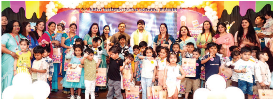
ओरिएंटेशन डे पर अतिथियों के साथ नवप्रवेशी छात्र-छात्राएं।