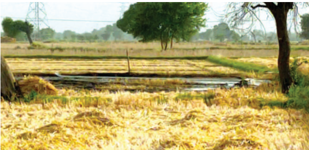
खेत में पड़े पुआल में आग बुझाने के बाद।

मौके पर काम कर रहे पड़ोसी किसानों ने तुरंत पानी का छिड़काव शुरू कर दिया। उनकी सक्रियता से आग खड़ी फसल तक नहीं पहुंच सकी। एक बड़ा हादसा टल गया। इस अग्निकांड की सूचना अग्निशमन विभाग को नहीं दी गई। पुलिस भी मौके पर नहीं पहुंची। अग्निशमन विभाग ने स्पष्ट किया कि इस घटना से जुड़ी कोई रिपोर्ट हमारे पास नहीं है। जब इस प्रकरण की जानकारी तहसील से ली गई तो सामने आया कि