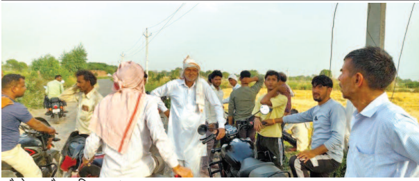
मौके पर मौजूद किसान।