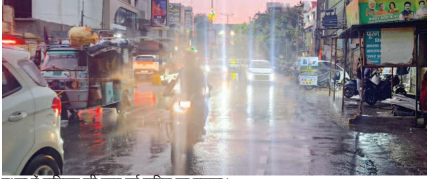
मथुरा में शनिवार की शाम हुई बारिश का नजारा।

यूनिक समय, मथुरा। शनिवार की शाम मौसम ने फिर अंगड़ाई ली। रात का अधियारा होने से पहले आसमान में छाए काले बादलों ने जिले के अधिकांश क्षेत्रों में अंधेरा सा कर दिया। आसमान में बादलों के बीच कड़कड़ाती बिजली और मूसलाधार बारिश से जन जीवन अस्त व्यस्त सा हो गया। कोसीकलां मंडी परिसर में अन्नदाता का रखा अनाज पानी में पूरी तरह से तर तबर हो गया। यहां टीन शैड न होने से अनाज से भरी बोखियां खुले मैदान में रखी थीं बारिश के कारण