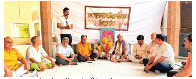
ब्रज-वृन्दावन धरोहर संरक्षण विचार मंच की बैठक में प्रबुद्धजन।