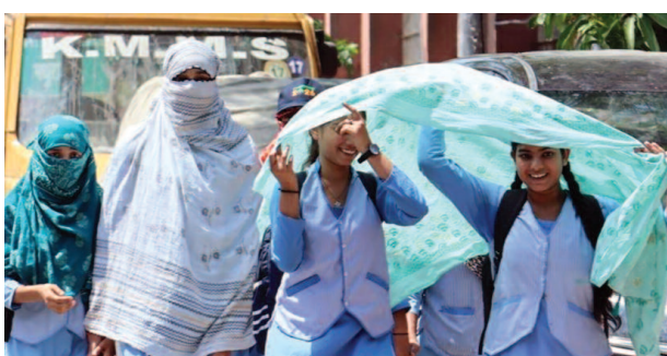
कालेज की छुट्टी होने के बाद दुपट्टा ओढ़े कर चल रही छात्राएं।

शनिवार को तापमान 40 डिग्री के पार जाने पर भगवान भास्कर के तेवर भी तलख होने लगे। सुबह नौ