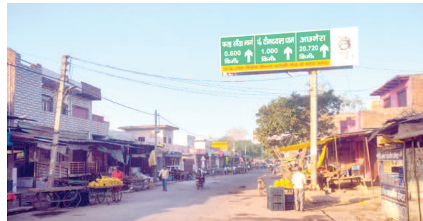
फरह कस्बा के समीप रेलवे फाटक मार्ग पर लगा साइन बोर्ड।

स्थान की दूरी दर्शाने वाले बोर्ड का पिलर गल गया है नीचे से