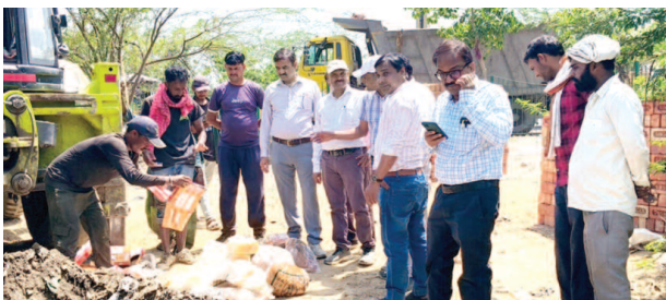
खाद्य विभाग की टीम छोपे मारी करते हुए।