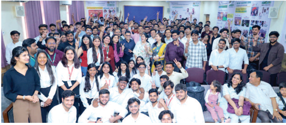
जीएलए विश्वविद्यालय, मथुरा में आयोजित अल्युमिनाई इंटरैक्शन के दौरान अल्युमिनाई के साथ छात्र-छात्राएं एवं पदाधिकारीगण।