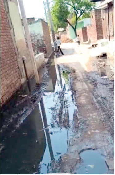
ग्राम बाटी में गंदगी और जलभराव के हालात।