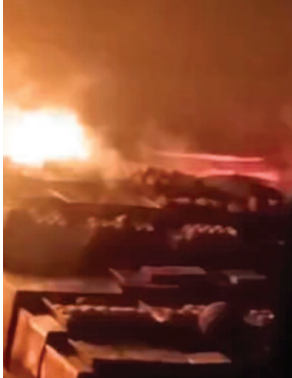
बांके बिहारी मंदिर वाली गली में मिठाई की दुकान में उल्टी आग की लपटें।

यूनिक समय, मथुरा। बांके बिहारी मंदिर स्थित बाजार में एक मिठाई की दुकान में बिजली का शॉर्ट सर्किट होने से भीषण आग लग गई, जिस कारण इलाके में अफरा-तफरी मच गई। प्रातः का समय होने के कारण मंदिर में दर्शन करने वालों और बाजार में खरीददारी करने वाले लोगों की भीड़ नहीं थी। आग की सूचना पर पहुंची फायर ब्रिगेड ने एक घंटे की कड़ी मशक्कत के बाद आग पर काबू पाया।