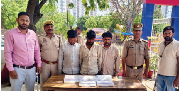
पुलिस की गिरफ्त में सवारियों का सामान चोरी करने वाले गैंग के तीन सदस्य और बरामद माल।

हाइवे सहित अन्य मार्गों पर ईको कार अथवा अन्य किसी वाहन को लेकर लूटपाट का शिकार करने वाला गैंग सड़क पर निकल जाता था। वाहन के इंतजार में खड़े लोगों को उनके स्थान पर जाने की बात कहकर बिठा कर रास्ते में उनके बैग आदि से कीमती जेवर और नकदी आदि चोरी कर रहे थे। इस मामले में कई शिकायतें पुलिस को मिली थी। पुलिस ने