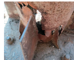
साइन बोर्ड का नीचे से गला पिलर।

की गिरने से किसी दिन हादसा होने की भी आशंका है।