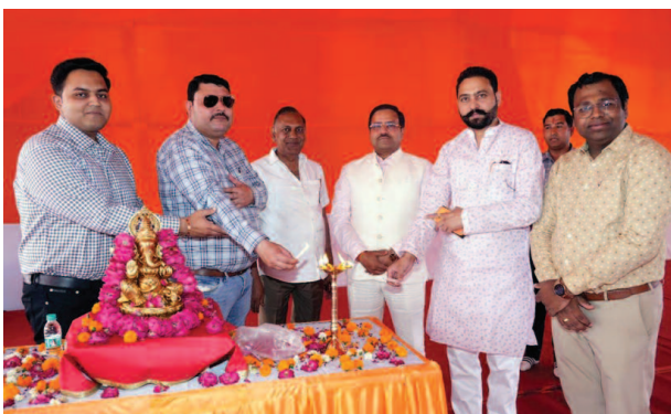
अर्थ हाउसिंग बिल्डर्स के द्वारा अक्षय तृतीया के उपलक्ष्य में गणेश जी के चित्र के समक्ष दीप प्रज्वलित करते हुए।

यूनिक समय, मथुरा। कान्हा की नगरी मथुरा में अक्षय तृतीया के पावन अवसर पर अर्थ हाउसिंग के द्वारा एक विशेष ऑफर दिया जा रहा है, यह आयोजन श्री वृंदावन विहार में 17 अप्रैल से 19 अप्रैल तक आयोजित किया गया। जिसमें लोगों को प्रॉपर्टी खरीदने के साथ-साथ कई आकर्षक लाभ भी दिए जा रहे हैं। इस विशेष योजना के अंतर्गत ग्राहकों को प्लॉट के साथ गोल्ड पाने का अवसर दिया जा रहा है, साथ ही परिवार के साथ विदेश यात्रा पर जाने का सुनहरा मौका भी इस योजना में जाने का मौका मिल रहा है। जिससे लोगों में खासा उत्साह देखने को मिला। अक्षय तृतीया जैसे शुभ पर्व पर इस तरह की योजना को लोगों ने काफी सराहा। कार्यक्रम का शुभारंभ मां सरस्वती के