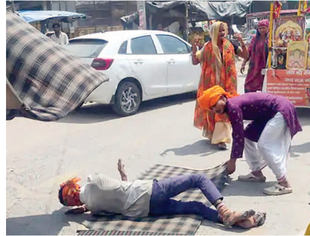
गाय को राष्ट्रीय माता घोषित कराने के लिए सड़क पर लुढ़क कर यात्रा करता युवक, साथ में है उसका परिवार।

यूनिक समय मथुरा। एक युवक अपने परिवार के साथ गो माता को राष्ट्रीय माता घोषित कराने के लिए अनौखी यात्रा कर लोगों को जागरूक कर रहा है। बुलंदशहर से शुरू हुई यह अनौखी यात्रा कोसीकलां पहुंची। यहां पर लोगों ने यात्रा का स्वागत किया।