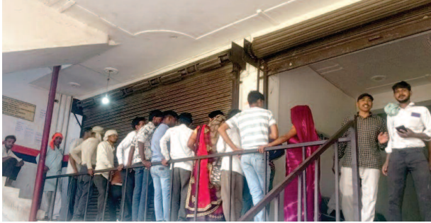
बलदेव गैस एजेंसी पर अपनी बारी का इंतजार करते हुए उपभोक्ता

यूनिक समय, बलदेव। कस्बा बलदेव के क्षेत्र में गैस की किल्लत योजना बढ़ती जा रही है। सिलेंडर लेने के लिए योजना गैस के गोदामों पर मारा मारी हो रही है। सिलेंडर की बुकिंग की पर्ची लेने के लिए सुबह आठ बजे से ही उपभोक्ता स्वाति गैस सर्विस के ऑफिस पर आ जाते हैं। वहीं बलदेव के व्यापारियों का बुरा हाल है, किसी दुकान स्वामियों को कॉमर्शियल सिलेंडर नहीं मिल रहे हैं। जिसके कारण ब्रज के होने वाले सुबह नास्ते की दुकानें बंद होने के कगार पर चल रही हैं। दुकानदारों के सामने रोजी रोटी का संकट आ रहा है, ये लोग ब्लैक में हॉकर से सिलेंडर खरीद कर अपना काम चला रहे हैं। वहीं