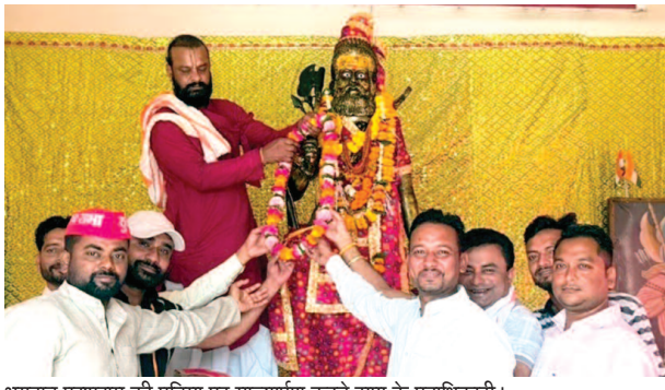
भगवान परशुराम की प्रतिमा पर माल्यार्पण करते सपा के पदाधिकारी।