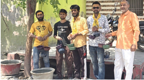
अक्षय तृतीया पर मोहनेश्वर महादेव मित्र मंडल के द्वारा पशु, पंखियों के लिए हौदिया लगाते हुए।