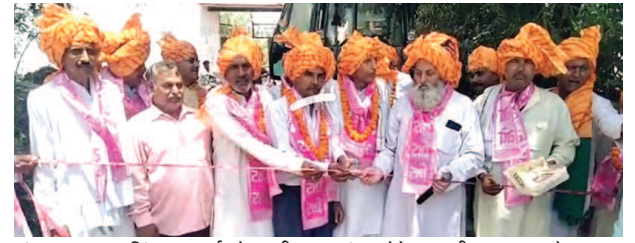
गांव नगला अनूप सिंह भरनखुर्द को पक्की सड़क मंजूर होने पर ग्रामीण जश्न मनाते हुए।