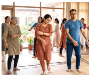
जाता है, तो वह अनकही भावनाओं को व्यक्त करने लगता है।

इस पद्धति में व्यक्ति अपने शरीर को हल्के-हल्के झटका या कांपने देता है, जिससे दबी हुई भावनाएं धीरे-धीरे बाहर आने लगती हैं। विशेषज्ञों का मानना है कि कई बार हम अपने दर्द या आघात को शब्दों में व्यक्त नहीं कर पाते, लेकिन शरीर उन अनुभवों को संजोकर रखता है। ऐसे में जब शरीर को स्वतंत्र रूप से हिलने-डुलने दिया