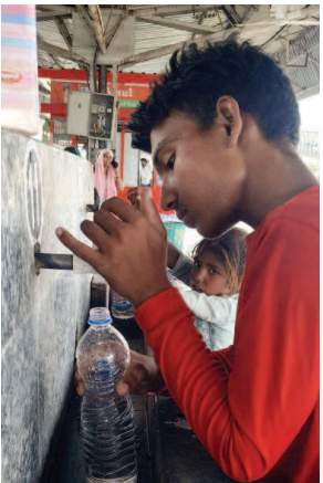
तीन नंबर प्लेटफार्म पर लगे नल में पानी कम आने से यात्री परेशान।