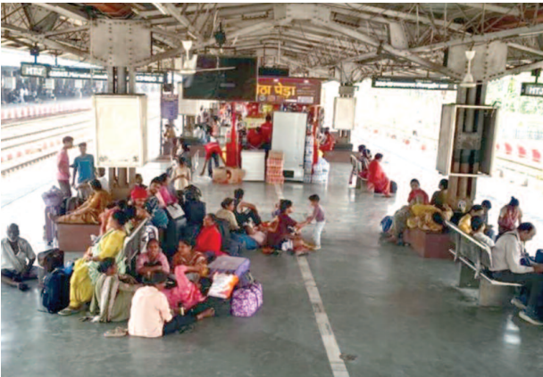
दो एवं तीन नंबर प्लेटफार्म खाली।