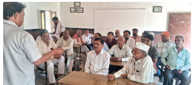
चामुंडा कॉलोनी स्थित महाराजा सूर्यसेन सैनी पब्लिक स्कूल में बैठक को संबोधित करते वक्ता।