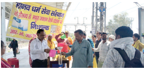
मथुरा जंक्शन पर मानव धर्म सेवा संस्थान के कार्यकर्ता यात्रियों को ठंडा पानी पिलाते हुए।

यूनिक समय, मथुरा। आसमान से बरस रही आग से मथुरा जंक्शन रेलवे स्टेशन पर सन्नाटा पसरा दिखाई दिया। शुक्रवार को यूनिक समय टीम ने स्टेशन