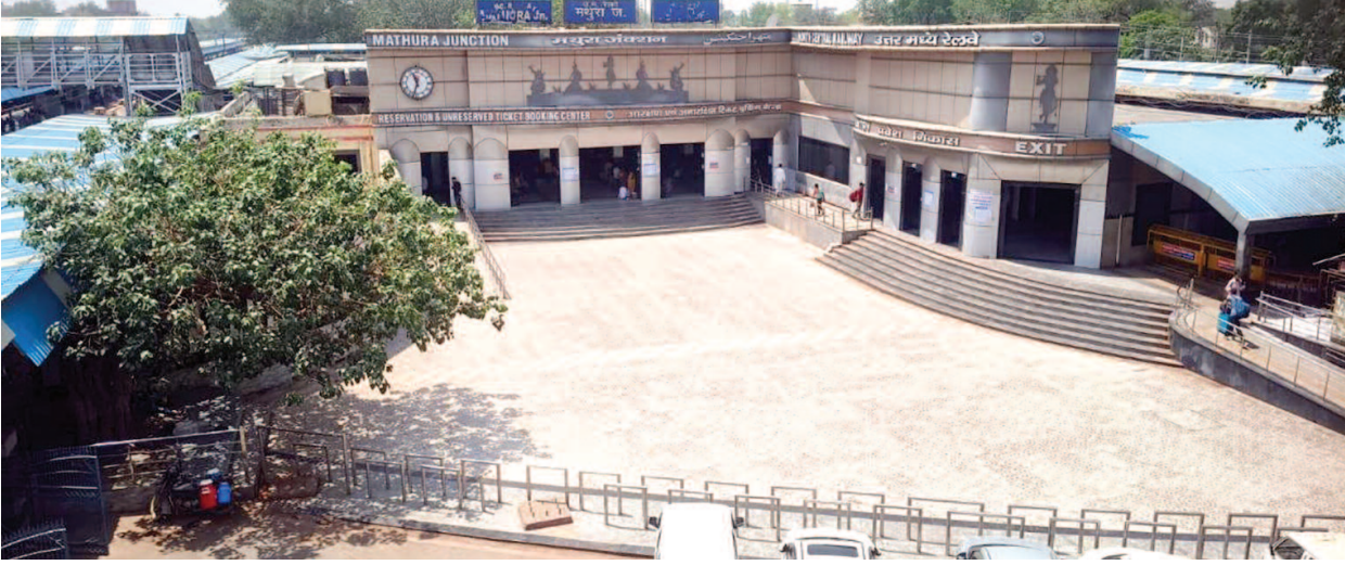
मथुरा जंक्शन के मैन गेट पर पसरा सन्नाटा।