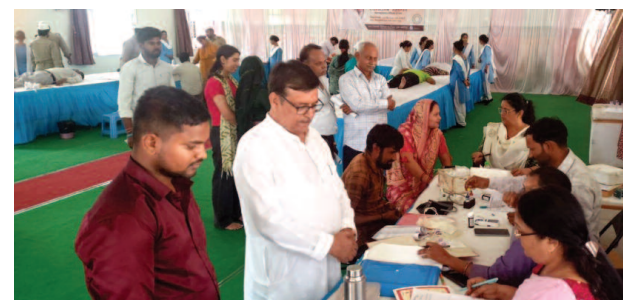
मथुरा में लगाए रक्तदान शिविर की व्यवस्था देखते पदाधिकारी।