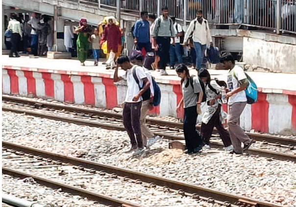
चार नंबर प्लेटफार्म से तीन नंबर पर आने के लिए रेलवे लाइन पार करते लोग।