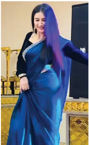
प्राफाइल के अनुसार वह मथुरा की रहने वाली हैं। उनकी प्रोफाइल पर शादी और फैमिली फंक्शन से जुड़े कई डांस वीडियो पहले से मौजूद हैं, लेकिन यह वीडियो सबसे ज्यादा वायरल हुआ है।