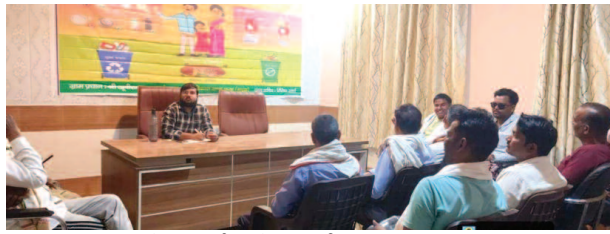
पंचायत दिवस पर आयोजित कार्यक्रम में अधिकारी।

यूनिक समय, मथुरा। राष्ट्रीय पंचायती राज दिवस पर जिले की 495 ग्राम पंचायतों में लोकतंत्र और विकास को मजबूत करने के लिए व्यापक कार्यक्रम आयोजित किए गए। जिला पंचायत राज अधिकारी कार्यालय द्वारा जारी निर्देशों के तहत आज जिले की सभी त्रिस्तरीय पंचायतों जिला, क्षेत्र और ग्राम स्तर पर विशेष ग्राम सभाएं और जागरूकता कार्यक्रम आयोजित किए गए। कार्यक्रमों में स्थानीय विकास योजनाओं, स्वच्छता, जल संरक्षण, महिला नेतृत्व और पंचायत सशक्तिकरण जैसे मुद्दों पर विस्तार से चर्चा की गई।