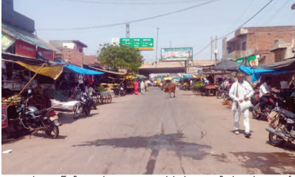
शुक्रवार दोपहर गर्मी की वजह से सूना पड़ा कस्बा से रेलवे फाटक की ओर जाने वाला मार्ग।