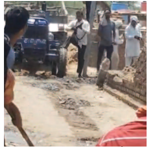
हथियार दिखाकर लोगों को भयभीत कर जमीन पर कब्जा करने का प्रयास करते लोग।