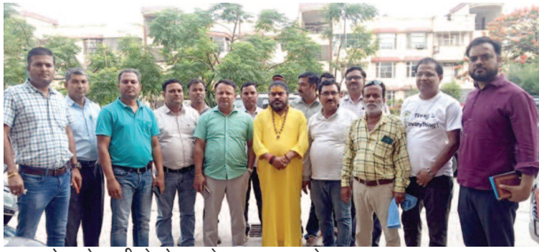
कृष्ण लोक सोसायटी के लोग गुस्से का इजहार करते हुए।

सोसायटी के फ्लैटों में रह रहे बच्चों और बुजुर्गों समेत कई लोग अचानक पेट दर्द और लूज मोशन की चपेट में आ गए। देखते ही देखते बीमारों की संख्या बढ़ने लगी, जिससे पूरी सोसायटी में हड़कंप मच गया। घटना की सूचना मिलते ही स्वास्थ्य विभाग की टीम सक्रिय हो गई। सामुदायिक स्वास्थ्य केंद्र राल के