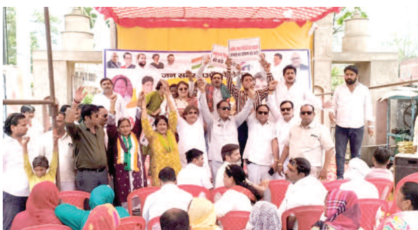
वृंदावन स्थित चुंगी चौराहा पर कांग्रेस कार्यकर्ता समस्याओं को लेकर हुंकार भरते हुए।