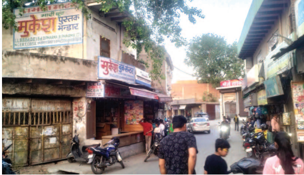
भैस भहोरा के बुक स्टोरों पर कक्षा 9 के छात्र किताबों की जानकारी करने के बाद लौटते हुए।

यूनिक समय, मथुरा। जिले में कक्षा नौ के छात्रों के सामने इस समय बड़ी शैक्षणिक चुनौती खड़ी हो गई है। यूनिट टेस्ट शुरू होने में केवल तीन-चार दिन बचे हैं, लेकिन बाजार में अभी तक एनसीईआरटी और सीबीएसई बोर्ड की सभी आवश्यक किताबें नहीं मिल रही हैं, जो किताबें बाजार में आई थीं, अब वो भी अब बुक स्टोरों से पूरी तरह गायब हो चुकी हैं। ऐसे में छात्रों की पढ़ाई पर सीधा असर पड़ रहा है और उनकी तैयारी अधूरी रह गई है। छात्रों का कहना है कि बिना किताबों के पढ़ाई करना असंभव हो गया है। स्कूलों में अध्यापन तो जारी है, लेकिन घर पर अभ्यास और पुनरावृत्ति