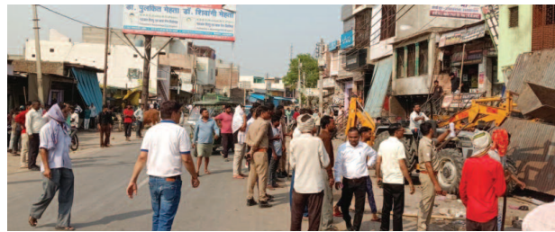
पुलिस की मौजूदगी में अतिक्रमण हटाते बुलडोजर को देखते लोग।

यूनिक समय, बाजना। कस्बा में लंबे समय से सड़कों को घेरकर किए गए अवैध अतिक्रमण के खिलाफ आखिरकार प्रशासन का डंडा चल गया है। सोमवार को नगर पंचायत और तहसील प्रशासन की टीम ने कस्बा के मुख्य व्यापारिक मार्गों पर सघन 'अतिक्रमण हटाओ अभियान' चलाया। इस कार्रवाई से अतिक्रमणकारियों में हड़कंप मच गया और देखते ही देखते संकरी हो चुकी सड़कें अपने पुराने स्वरूप में नजर आने लगीं। सड़कों पर बढ़ते अवैध कब्जे और उससे आम जनता को होने वाली परेशानियों को लेकर लगातार आवाज उठाई जा रही