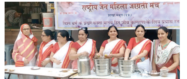
राष्ट्रीय जैन महिला जाग्रती मंच की महिला प्रसाद वितरित करते हुए।

सहभागिता की। शोभायात्रा में भगवान गणेश, शिव-पार्वती, दुर्गा माता, राम दरबार, राधा-कृष्ण तथा महाराणा प्रताप की आकर्षक झांकियां लोगों के आकर्षण का केंद्र रही। कार्यक्रम के दौरान गोरिल्ला डांस और घोड़ा डांस ने भी लोगों का खूब मनोरंजन किया। रैली मार्ग पर जगह-जगह ग्रामीणों द्वारा स्वागत किया।