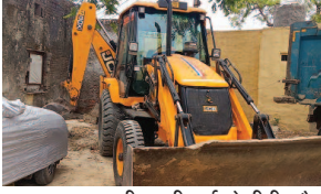
प्रशासन द्वारा सीज की गई जेसीबी और ट्रैक्टर।