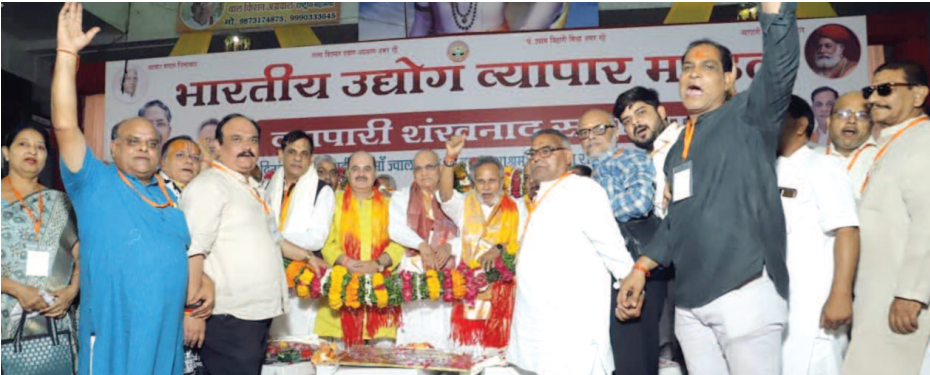
भारतीय उद्योग व्यापार मंडल के बैनर तले वृंदावन में आयोजित राष्ट्रीय अधिवेशन के प्रारंभ में राष्ट्रीय पदाधिकारियों का स्वागत करते स्थानीय व्यापारी बंधु।