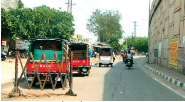
फरह स्थित अंडरपास के समीप सवारी भरने के लिए खड़े टैपो।

यूनिक समय, फरह। रोडवेज अधिकारियों की लाचारी कस्बा और क्षेत्र के लोगों के लिए टैपो की सवारी की वजह बन गई है। रोडवेज बसों के अभाव में यात्री आगरा और मथुरा के लिए टैपो से टुकड़ों में यात्रा करने को मजबूर हैं। परिवहन मंत्री के दावे भी धरातल पर नहीं उतर रहे हैं। अंडरपास के ऊपर से निकल रही बसें स्थानीय यात्रियों के लिए सपना साबित हो रही हैं। गर्मी के मौसम में रोडवेज की बसें खाली दौड़ती नजर आ रही हैं। चंद सवारियों के सहारे बसों को सड़क पर दौड़ाया जा रहा है। ऐसे में रोडवेज के अधिकारी आय बढ़ाने के लिए ग्रामीण बस सेवा संचालित करने का नया आइडिया खोज कर लाए हैं, लेकिन इसके बाद भी यात्रियों को सरकारी बस सेवा का लाभ नहीं मिल पा रहा है। कुछ ऐसा ही हाल कस्बा और क्षेत्र के लोगों के साथ हो रहा है। कस्बा और दर्जनों गांवों के करीब एक हजार से अधिक लोग प्रतिदिन