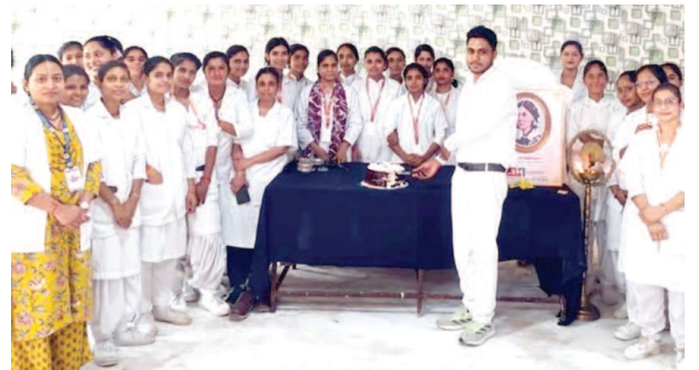
अंतरराष्ट्रीय नर्सिंग दिवस पर केक काटता नर्सिंग स्टाफ।

यूनिक समय, गोवर्धन। गोवर्धन स्थित जीएम नर्सिंग पैरामेडिकल कॉलेज एंड हॉस्पिटल में मंगलवार को अंतरराष्ट्रीय नर्सिंग दिवस उत्साह एवं गरिमामय वातावरण में मनाया गया। कार्यक्रम का शुभारंभ जिला विधिक सेवा प्राधिकरण के अधिकारियों द्वारा दीप प्रज्वलन एवं केक काटकर किया गया। इस दौरान छात्र-छात्राओं को नर्सिंग सेवा, मानवता एवं सामाजिक दायित्वों की शपथ दिलाई गई।