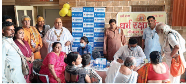
निशुल्क स्वास्थ्य शिविर में रोगियों की जांच करते डाक्टर।

यूनिक समय, वृंदावन। परिक्रमा मार्ग स्थित राधा प्रसाद धाम में सेवा और स्वास्थ्य के संकल्प के साथ एक विशाल निःशुल्क स्वास्थ्य शिविर लगाया।