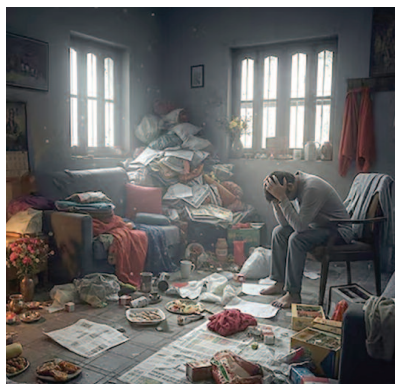
जमा रखना मानसिक अशांति का कारण बनता

विशेषज्ञों का मानना है कि घर में फैली गंदगी, अव्यवस्थित सामान, बंद कमरे और अंधेरे कोने धीरे-धीरे सकारात्मक ऊर्जा को कम कर देते हैं। इससे परिवार के सदस्यों के बीच चिड़चिड़ापन और बेवजह के झगड़े बढ़ सकते हैं। वास्तु के अनुसार उत्तर-पूर्व दिशा में भारी सामान रखना और घर में लंबे समय तक कबाड़