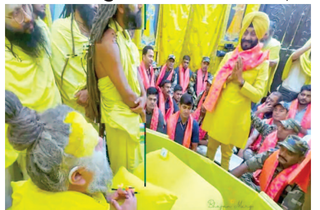
संत प्रेमानंद महाराज से मुलाकात करते एंटी टेररिस्ट फ्रंट के अध्यक्ष मनिंदरजीत सिंह बिट्टा।