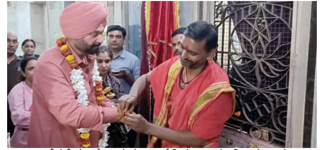
मां कात्यायनी देवी के दर्शन करने के बाद पूर्व क्रिकेटर नवजोत सिद्धू के हाथ में कलावा बांधते सेवायत पुजारी।

यूनिक समय, वृंदावन। पूर्व क्रिकेटर नवजोत सिंह सिद्धू ने अपनी बेटी के साथ कात्यायनी शक्तिपीठ में दर्शन कर पूजा-अर्चना की। उन्होंने इसे पूरी तरह निजी आध्यात्मिक यात्रा बताते हुए राजनीति से दूरी बनाए