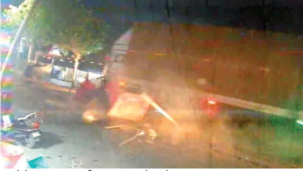
हादसे के बाद सड़क पर बिखरा सामान और कंटेनर।

यूनिक समय मथुरा। राष्ट्रीय राजमार्ग पर देर रात थाना गोविंदनगर क्षेत्र में अनियंत्रित कंटेनर ने फुटपाथ पर खड़े होकर चाय पीते चार लोगों को रौंदा दिया। शोर सुनकर आस-पास के लोगों ने घायलों को हटाया और दुर्घटना कर भागते चालक को पकड़ लिया। पुलिस के पहुंचने तक दो घायलों ने दम तोड़ दिया। पुलिस ने