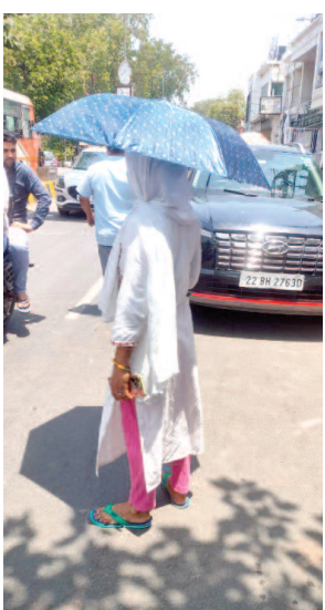
धूप से बचने के लिए छाता लगाकर वाहन का इंतजार करती महिला।

यूनिक समय, मथुरा। लू के थपेड़ों ने सूरज की लपटों को हवा दी तो लोग