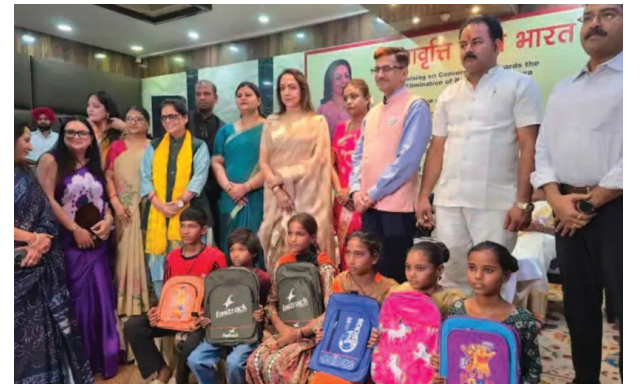
भिक्षावृत्ति मुक्त भारत अभियान के तहत प्रशिक्षण कार्यक्रम में सांसद हेमामालिनी के साथ पदाधिकारी।

यूनिक समय, मथुरा। भिक्षावृत्ति मुक्त भारत अभियान को गति देने के उद्देश्य से स्माइल योजना के अंतर्गत उम्मीद संस्था ने राष्ट्रीय सामाजिक रक्षा संस्थान (निषाद) के सहयोग से ट्रेनिंग ऑन कन्वर्जेंस टुवर्ड्स द एलिमिनेशन ऑफ बैगरी विषय पर राज्य स्तरीय प्रशिक्षण कार्यक्रम का आयोजन किया। इसमें सांसद हेमामालिनी ने भी भाग लिया।