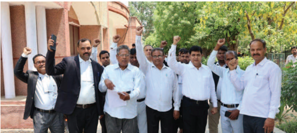
लखनऊ में अधिवक्ताओं के चैबर तोड़ने के विरोध में डीएम को ज्ञापन देकर आते अधिवक्ता।

यूनिक समय, मथुरा। राजधानी लखनऊ में चैबर तोड़ जाने पर मथुरा के अधिवक्ताओं ने नाराजगी जताई है। डीएम को दिए गए ज्ञापन में राज्यपाल से मामले में हस्तक्षेप करके अधिवक्ताओं के लिए वैकल्पिक स्थान की मांग की गई है।