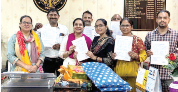
तैनाती पत्र पाकर मुस्कराते छह विशेष शिक्षक।