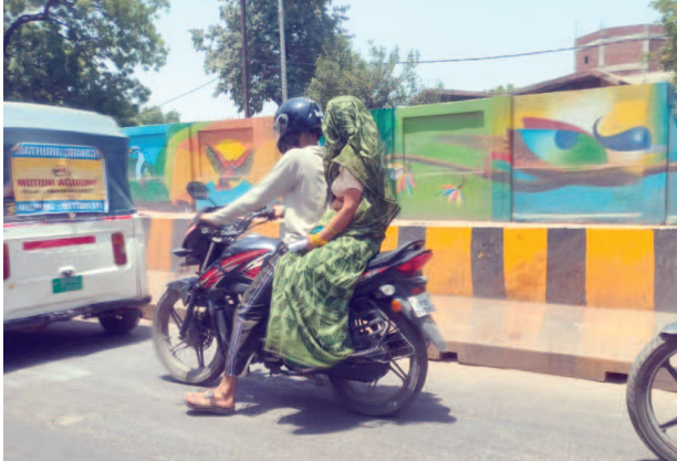
धूप से बचने के लिए सिर पर पल्लू करके बाइक पर बैठी महिला।