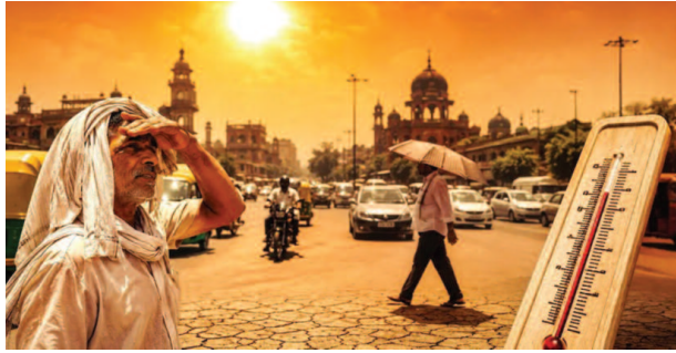
जारी आंकड़ों के अनुसार बांदा, मुरादाबाद, इटावा और औरैया में

यूनिक समय, लखनऊ। उत्तर प्रदेश इस समय भीषण गर्मी और लू की चपेट में है। हालात इतने गंभीर हो चुके हैं कि राज्य के 40 जिले दुनिया के 100 सबसे गर्म शहरों की सूची में शामिल हो गए हैं। लगातार बढ़ते तापमान और झुलसाने वाली गर्म हवाओं ने आम जनजीवन को बुरी तरह प्रभावित कर दिया है। दोपहर के समय सड़कें सूनी दिखाई दे रही हैं और लोग जरूरी काम होने पर ही घरों से बाहर निकल रहे हैं।