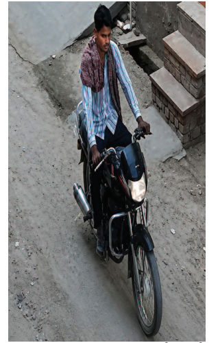
महेंद्र नगर के एक मकान के समीप खड़ी बाइक को चोरी करके ले जाता चोर।