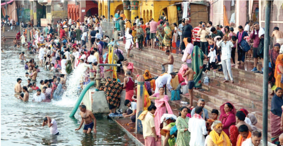
गंगा दशहरा पर्व पर शहर के विश्राम घाट पर यमुना में स्नान करते श्रद्धालु।

समूचे जिले में श्रद्धालुओं ने किया यमुना स्नान