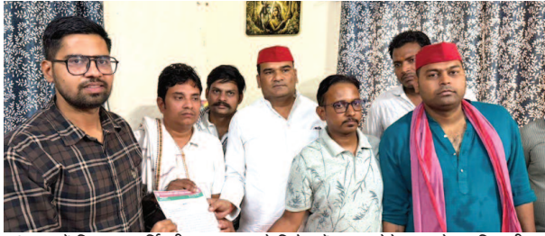
वृंदावन में विद्युत आपूर्ति की अव्यवस्था के विरोध में ज्ञापन देते सपा के पदाधिकारी।