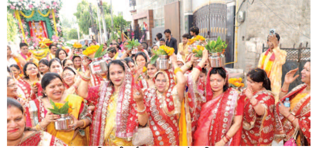
भागवत कथा शुभारंभ पर निकाली गई कलश यात्रा में शामिल श्रद्धालु।