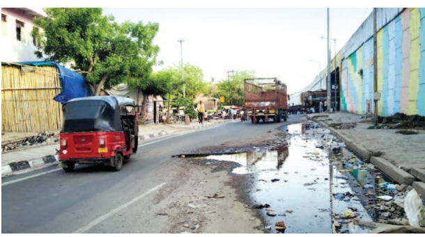
छाता के पास हाईवे पर दिखाई दे रहा गड्ढा।

यूनिक समय, छाता (मथुरा)। नेशनल हाईवे पर सफर करने वाले राहगीरों के लिए इन दिनों सफर किसी बुरे सपने से कम नहीं रह गया है। दिल्ली-आगरा नेशनल हाईवे छाता स्थित सर्विस लाइन पर बना एक विशालकाय गड्ढा राहगीरों के लिए बड़ा ही दुखदाई और जानलेवा साबित हो सकता है। दिन के उजाले में तो जैसे-तैसे वाहन चालक बचकर निकल जाते हैं, लेकिन रात के अंधेरे में यह गड्ढा किसी बड़े हादसे की शकल कर लेता है। सबसे हैरान करने वाली बात यह है कि इस मार्ग से रोजाना हजारों वाहनों और प्रशासनिक अधिकारियों का आना-जाना होता है, लेकिन इस गंभीर समस्या की सुध लेने