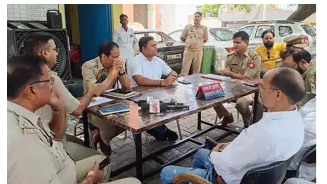
थाने में आयोजित पीस कमेटी की बैठक में मौजूद एसडीएम और सीओ आदि।

यूनिक समय, फरह। रविवार को स्थानीय थाने में आयोजित पीस कमेटी की बैठक में अधिकारियों ने शांति का पाठ पढ़ाया। बकरीद का त्योहार सद्भाव से मनाने को समझाया। कहा कि माहौल खराब करने वालों को छोड़ा नहीं जाएगा।