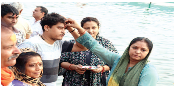
गंगा दशहरा पर्व पर यमुना स्नान के बाद भाई को तिलक करती बहन।

तिलक किया और यमुना मां की आराधना की। बच्चों का भी मुंडन