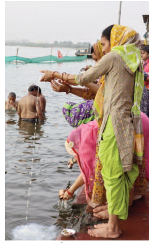
गंगा दशहरा पर्व पर स्नान के बाद यमुना मड़या का अभिषेक करती श्रद्धालु।

तिलक किया और यमुना मां की आराधना की। बच्चों का भी मुंडन