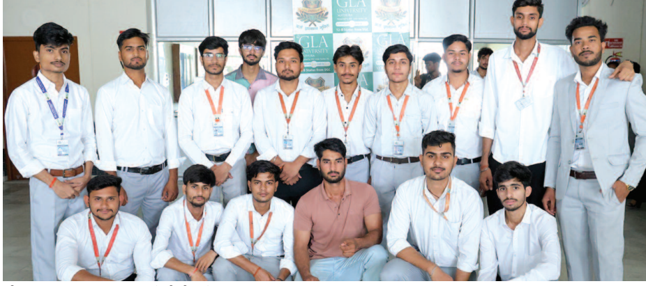
जीएलए विश्वविद्यालय, मथुरा के बीसीए के चयनित छात्र।

कंपनी द्वारा आयोजित चयन प्रक्रिया में एप्टीट्यूट टेस्ट, टेक्निकल राउंड, कम्प्यूटेशन स्किल और पर्सनल इंटरव्यू जैसे विभिन्न चरण शामिल रहे। जीएलए विश्वविद्यालय के विद्यार्थियों ने सभी चरणों में उत्कृष्ट प्रदर्शन करते हुए अपनी तकनीकी क्षमता, तार्किक सोच और प्रोफेशनल दक्षता का प्रभावशाली परिचय दिया।