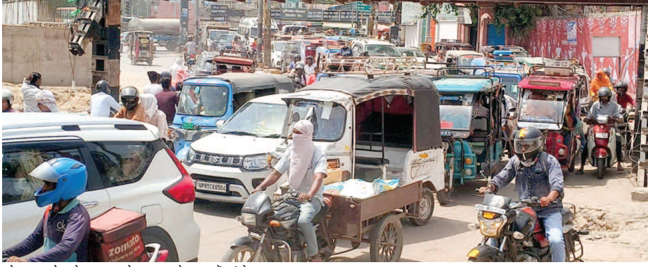
सोमवार को भूतेश्वर पुल के पास लगे जाम में फंसे वाहन।

यूनिक समय, मथुरा। गर्मी में शहर की यातायात व्यवस्था पंगु हो गई है। हर चौराहा-तिराहा और प्रमुख मार्ग जाम से बिलबिला रहे हैं, वाहन भी रेंग-रेंग खिसकते रहे। सोमवार को तपती गर्मी में लगा जाम शहर का ताप बढ़ाता रहा, लेकिन जिम्मेदार व्यवस्था संभालने के बजाय छांव में बैठे रहे। ऐसे में नागरिक केवल हार्न बजाकर आगे बढ़ने की कोशिश करते रहे।