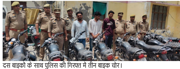
दस बाइकों के साथ पुलिस की गिरफ्त में तीन बाइक चोर।

यूनिक समय, मथुरा। कोतवाली पुलिस ने तीन अंतरराज्यीय वाहन चोरों को गिरफ्तार कर उनके कब्जे से चोरी की दस बाइकें बरामद की है। कोतवाली पुलिस ने चेकिंग के दौरान रेलवे ग्राउंड की दीवार के समीप बाइक पर जाते तीन युवकों को रोका। युवकों से पुलिस ने बाइक के कागजात दिखाने के लिए कहा। युवकों के पास बाइक से संबंधित कोई कागज नहीं मिला। पुलिस ने युवकों से कड़ाई से