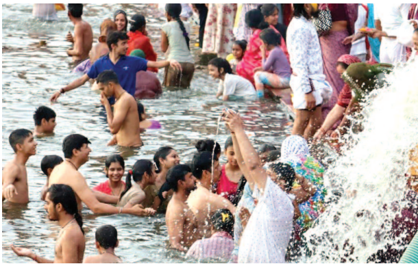
गंगा दशहरा पर्व पर शहर स्थित यमुना में स्नान करते श्रद्धालु।

गंगा दशहरा पर मथुरा में सुबह से ही श्रद्धालु यमुना घाटों पर पहुंच गए। आस्था और श्रद्धा के भाव के साथ यमुना में डुबकी लगाई गई। स्नान के बाद बहनों ने भाई को