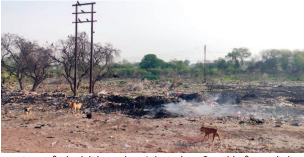
नगर पंचायत की ओर से फेंके जा रहे कचरे में मांस के अपशिष्ट होने की वजह से मौजूद श्वान और चील- बाज आदि।

नगर पंचायत कई साल से ब्लाक कार्यालय के समीप खाली जमीन पर कस्बा से समेटे जाने वाली गंदगी को डालती आ रही है। पूर्व में इस जमीन पर ईट भट्टा संचालित होने के दौरान मिट्टी खनन का काम हुआ था, जिसकी वजह से गड्ढा हो गया। बरसात के