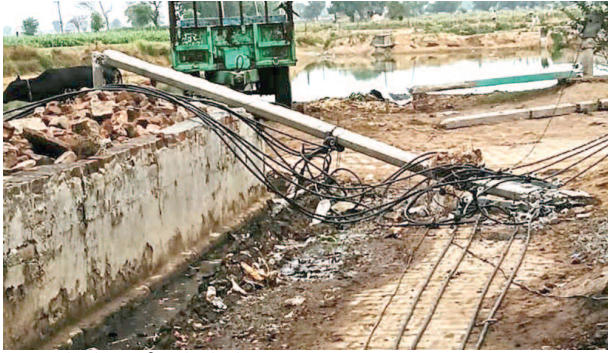
महावन में टूटे बिजली खंभे और पेड़।