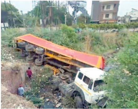
राधा वैली के सामने अनियंत्रित होकर पुल से गिरा ट्रक।

यूनिक समय, मथुरा। थाना हाईवे क्षेत्र में राधा वैली के सामने गुरु कृपा वाटिका के पास गुरुवार को उस समय अफरा-तफरी मच गई, जब चीनी से भरा एक ट्रक अचानक अनियंत्रित होकर पुल के नीचे जा गिरा। हादसे की आवाज सुनकर आसपास के लोग मौके पर पहुंच गए। प्रत्यक्षदर्शियों के अनुसार, ट्रक तेज रफतार में जा रहा था। इसी दौरान चालक वाहन से नियंत्रण खो बैठा, जिससे ट्रक सड़क किनारे पुल के नीचे जा गिरा। दुर्घटना इतनी भीषण थी कि ट्रक का अगला हिस्सा बुरी तरह क्षतिग्रस्त हो गया। घटना की सूचना मिलते ही स्थानीय लोग मौके पर पहुंचकर काफी मशक्कत के बाद घायल चालक को ट्रक से बाहर निकाला गया और उपचार के लिए नजदीकी अस्पताल में भर्ती कराया गया।