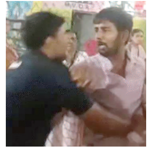
श्रद्धालु से मारपीट करता गार्ड।

इंटरनेट मीडिया पर वायरल वीडियो में दिख रहा है कि कई गार्ड्स एक व्यक्ति को बच्चों के सामने पीट रहे हैं, जबकि बच्चे अपने पिता को बचाने की गुहार