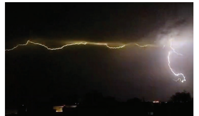
गुरुवार रात आसमान में चमकती आकाशीय बिजली।

मौसम विभाग ने बीते रोज गुरुवार को कई बार अलर्ट जारी किया था, जिले में 60 से 80 किमी. प्रति घंटे की गति से बयार चलने और आकाशीय गर्जना के साथ बूदाबादी होने का पूर्वानुमान जारी किया। इस अलर्ट के कुछ देर बाद मौसम खराब हुआ तो तेज गति से बयार चलने लगी। आकाशीय