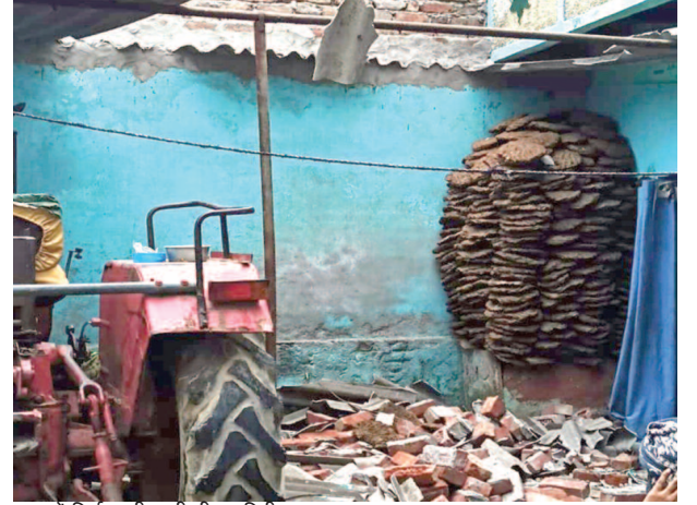
राया में निर्माणाधीन की दीवार गिरी।