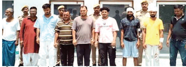
पुलिस हिरासत में महोली बवाल के आरोपित।

यूनिक समय, मथुरा। थाना हाइवे क्षेत्र के गांव महोली में दो गुटों के बीच हुई फायरिंग के मामले में पुलिस ने नौ आरोपियों को गिरफ्तार किया है।