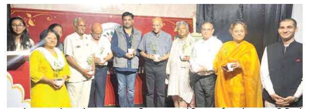
धरा चेतना फाउंडेशन के प्रथम स्थापना दिवस पर आयोजित कार्यक्रम में मुख्य अतिथि के साथ पदाधिकारी।