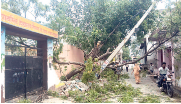
राया क्षेत्र के गांव गोसना स्थित प्राथमिक विद्यालय के बाहर टूटे बिजली खंभे और पेड़।

500 बिजली खंभे गिरे, 15 ट्रांसफार्मर क्षतिग्रस्त