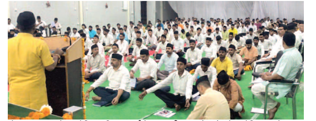
गो ग्राम परखम में आयोजित प्रशिक्षण वर्ग में सहभागी स्वयं सेवकों को संबोधित करते वक्ता।

यूनिक समय, फरह। गो ग्राम परखम में राष्ट्रीय स्वयंसेवक संघ ब्रज प्रांत के दो प्रशिक्षण वर्ग प्रारंभ हुए। यह दोनों वर्ग संघ शिक्षा वर्ग कार्यकर्ताओं की आयु वर्ग के अनुसार अलग अलग लगाए गए हैं। दीनदयाल गो विज्ञान अनुसंधान केंद्र परखम में बीते दिन गुरुवार से शुरू हुआ पहला संघ शिक्षा वर्ग सामान्य है, जिसमें 16 वर्ष से 40 वर्ष तक के 300 कार्यकर्ता प्रशिक्षण लेने के लिये पूरे ब्रज प्रांत से आए हैं। यह कार्यकर्ता 15 दिन तक लगातार देश सेवा के गुर सीखेंगे और व्यवस्थित दिनचर्या का पालन करेंगे, जिसे वह अपने जीवन में उतार सकें। जिसे महाविद्यालयी तरुण कार्यकर्ता सामान्य वर्ग नाम दिया गया है। दूसरा वर्ग विशेष वर्ग का है, इसमें 40 वर्ष से 65 वर्ष आयु वर्ग तक के करीब 200 कार्यकर्ता ब्रज प्रांत के विभिन्न जिलों से प्रशिक्षण को आए हैं। तरुण व्यवसायी और महाविद्यालयी छात्र सामान्य वर्ग का उद्घाटन करते हुये