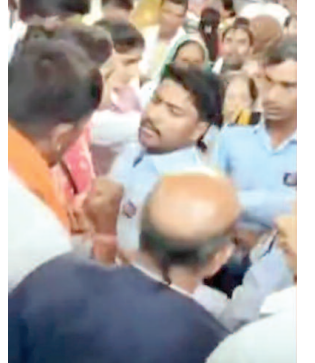
सुरक्षाकर्मियों और दरोगा परिवार में होती मारपीट।

दूसरे जनपद में तैनात एक दरोगा अपने परिवार के साथ दर्शन के लिए बरसाना पहुंचे थे। इसी दौरान वीआईपी प्रवेश को लेकर उनकी स्थानीय पुलिसकर्मी और निजी सुरक्षाकर्मियों से बहस हो गई। देखते ही देखते मामला बढ़ गया और मंदिर परिसर में अफरा-