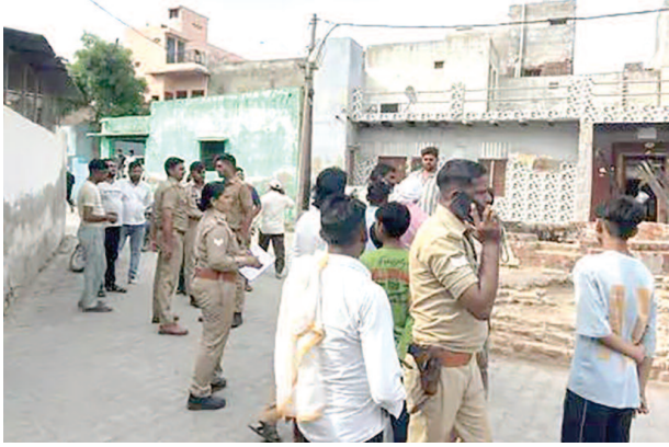
मांस के अवशेष मिलने की जानकारी के बाद मौके पर मौजूद पुलिसकर्मी।

जानकारी पर कोतवाली पुलिस और प्रशासनिक अधिकारी मौके पर पहुंचे। पुलिस ने लोगों को समझाकर शांत कराया और अफवाहों पर ध्यान न देने की अपील की। हालात को