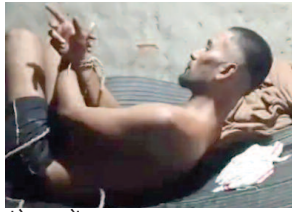
बंधे हाथ में युवक।