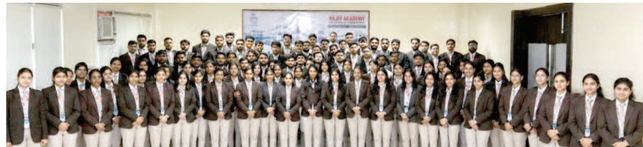
विभिन्न कम्पनियों में इंटरशिप के लिए चयनित राजीव एकेडमी के एमबीए प्रथम वर्ष के छात्र-छात्राएं।

यूनिक समय, मथुरा। राजीव एकेडमी फॉर टेक्नोलॉजी एंड मैनेजमेंट, मथुरा के एमबीए प्रथम वर्ष के छात्र-छात्राओं को प्रतिष्ठित कम्पनियों में समर इंटरशिप के 108 ऑफर मिले हैं। चयनित छात्र-छात्राओं को समर इंटरशिप के दौरान प्रतिष्ठित कम्पनियों में जहां कॉर्पोरेट जगत में कार्य करने का व्यावहारिक अनुभव मिलेगा, वहीं उन्हें कार्य संस्कृति को समझने और प्रबंधन कौशल निखारने में मदद मिलेगी। इंटरशिप के दौरान कम्पनियां छात्र-छात्राओं को सम्मानजनक स्टाइपेंड भी प्रदान करेंगी।