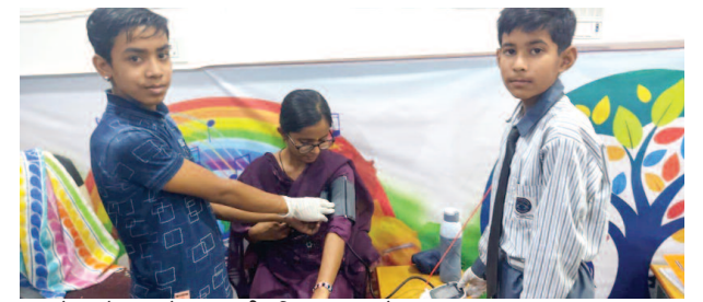
ब्लड प्रेशर चेक करते एलएलजी पब्लिक स्कूल के छात्र।

यूनिक समय, मथुरा। जनकपुरी स्थित एलएलजी पब्लिक स्कूल में विद्यार्थियों के लिए विशेष स्वास्थ्य जागरूकता कार्यक्रम का आयोजन हुआ। कार्यक्रम का उद्देश्य छात्रों को चिकित्सा क्षेत्र के प्रति प्रेरित कर उन्हें डॉक्टर बनने के लिए प्रोत्साहित करना था। इस अवसर पर छात्रों को ब्लड प्रेशर (रक्तचाप) की जांच करने के सामान्य नियमों और