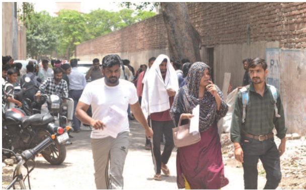
प्रेम देवी गर्ल्स इंटर कॉलेज से पुलिस परीक्षा देकर बाहर आते परीक्षार्थी।

यूनिक समय, मथुरा। जनपद में दो दिन से चल रही पुलिस भर्ती परीक्षा का समापन हुआ। बुधवार को 16 परीक्षा केंद्रों पर शांतिपूर्वक संपन्न हो गई। परीक्षा के दौरान सुरक्षा और निगरानी के व्यापक इंतजाम किए गए थे। परीक्षा देकर बाहर निकले कई अभ्यर्थियों ने बताया कि प्रश्नपत्र में गणित से जुड़े प्रश्न कुछ कठिन थे। प्रथम पाली में