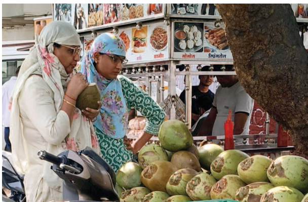
नारियल पानी पीती महिलाएं।

स्वास्थ्य के प्रति बढ़ती जागरूकता के चलते नारियल पानी की मांग लगातार बढ़ रही है। इसका सीधा असर सूखे गोले के उत्पादन और उपलब्धता पर पड़ रहा है, क्योंकि बड़ी मात्रा में नारियल पानी के लिए गोले नारियल का