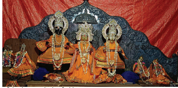
अभिषेक के बाद भक्तों को दर्शन देते रामचंद्र भगवान।