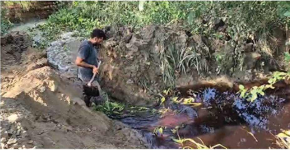
गांव झंडीपुर में माइनर में आए पानी के उफान को रोकने के लिए जुटा किसान।

यूनिक् समय, मथुरा। सिंचाई विभाग के ठेकेदार की करतूत से एक दर्जन से अधिक किसानों के सपने पानी में डूब गए। माइनर की पुलिया बनाने को ठेकेदार ने काम तो शुरू नहीं किया, लेकिन माइनर को बंद करा दिया, जिसकी वजह से रात को पानी उफान लेकर खेतों में घुस गया और फसल डुबो दी। सुबह खेतों की ओर गए किसान कपास, बाजरा और ज्वार की फसल को पानी में डूबी देखकर परेशान हो गए।