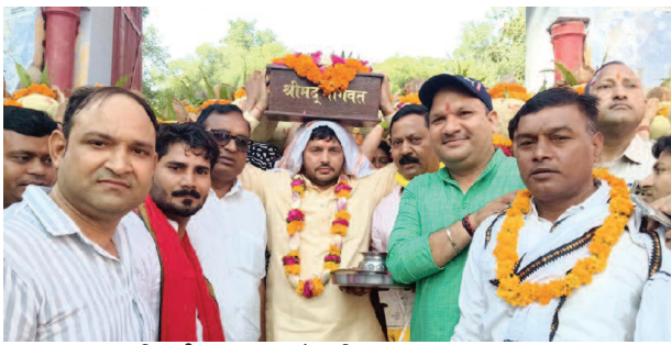
कथा शुभारंभ पर निकली कलश यात्रा में शामिल श्रद्धालु।

यूनिक समय, नौहड्डोल। बुधवार को कस्बा के शेरगढ़ रोड स्थित प्राचीन झाड़ी वाले हनुमान मंदिर पर 35वीं श्रीमद् भागवत कथा का भव्य शुभारंभ हुआ। आयोजन की शुरुआत अग्रवाल मंदिर से निकली भव्य- दिव्य कलश यात्रा के साथ हुई, जिसने पूरे कस्बे को भक्तिमय बना दिया। शोभायात्रा में 1101 महिलाओं ने सिर पर मंगल कलश धारण किए।