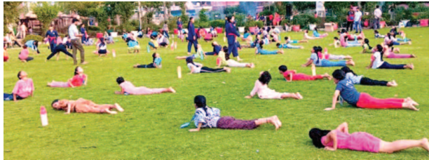
सेवार्थ टीम के बैनर तले गांधी पार्क में लगाए मार्शल आर्ट समर कैंप में आत्म रक्षा के गुर का प्रशिक्षण लेती बालिकाएं।