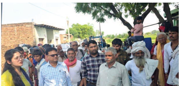
सराय स्थल पर सफाई के लिए लोगों को समझाते एडीएम न्यायिक वेद प्रिय आर्य।

इन दिनों ब्रज परिक्रमा का जोर चल रहा है। दोपहर और मध्य रात्रि के अलावा परिक्रमा मार्ग परिक्रमार्थियों से भरकर चल रहे हैं। अब तक परिक्रमा को 18 दिन का समय भी व्यतीत हो चुका है। ऐसे में अब अधिकमास में शेष दिनों के दौरान परिक्रमा लगाने वाले