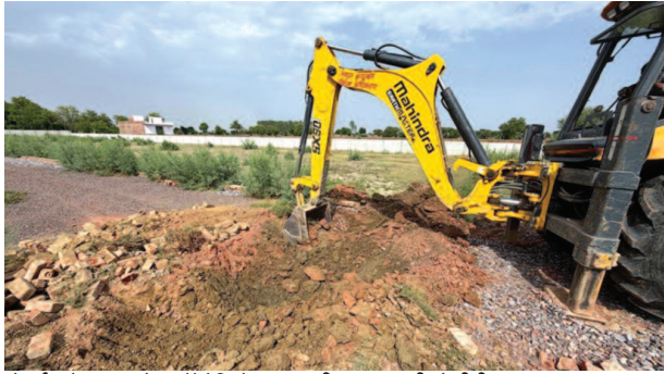
गोवर्धन रोड पर अवैध कॉलोनियों का ध्वस्तीकरण करती जेसीबी।

प्राधिकरण के अधिकारियों के अनुसार, रजवाहे से करीब 100 मीटर पहले गोवर्धन रोड पर लगभग 20 हजार वर्गमीटर क्षेत्र में कच्ची सड़क बनाकर कॉलोनी विकसित की जा रही थी। इस मामले में कई बार सुनवाई की तारीखें तय की गईं, लेकिन संबंधित लोग