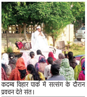
कदम्ब विहार पार्क में सत्संग के दौरान प्रवचन देते संत।

में ही सुविधा मिल जाएगी। उन्होंने बताया कि स्कूलों और कॉलेजों में भी यदि छात्र-छात्राओं के आधार कार्ड नहीं बने हैं तो वहां भी कैम्प लगाए जाएंगे। इससे विद्यार्थियों को प्रवेश और अन्य सरकारी योजनाओं में होने वाली दिक्कतों से राहत मिलेगी। खासकर नौकरीपेशा लोगों के लिए रविवार को आधार कार्ड बनवाने की सुविधा किसी खुशखबरी से कम नहीं है। अब लोग अपने अवकाश के दिन आराम से आधार संबंधी काम निपटा सकेंगे और उन्हें कार्यालयों के चक्कर भी नहीं लगाने पड़ेंगे।