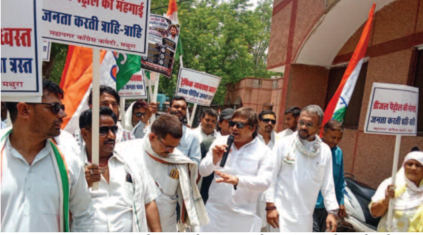
महानगर अध्यक्ष के नेतृत्व में डीएम कार्यालय पर प्रदर्शन करते कांग्रेसी कार्यकर्ता।

आम जन की जनसमस्याओं को लेकर कांग्रेसियों ने दिया ज्ञापन