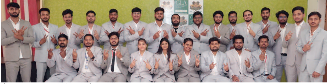
जीएलए विश्वविद्यालय, मथुरा के इलेक्ट्रिकल इंजीनियरिंग के चयनित छात्र-छात्रा।

इस वर्ष आयोजित कैम्पस प्लेसमेंट ड्राइव में टाटा पावर, कमिस इंडिया, जैक्सन, विवो, केईआई वायर्स एंड केबल्स, सिक्वोर मीटर्स, काउंटी ग्रुप, त्रिजाल इलेक्ट्रिक और तत्व इंटीरियर्स पैरामाउंट सहित कई प्रमुख कंपनियों ने भाग लिया। कंपनियों ने विद्यार्थियों की