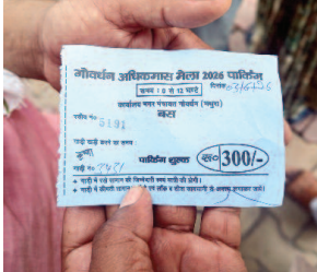
बस पार्किंग के नाम पर काटी गई तीन सौ रुपये की रसीद।

इन दिनों अधिकमास चल रहा है। चौरासी कोस की परिक्रमा के