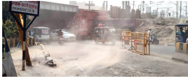
गुरुवार दोपहर नए बस स्टैंड के पास धूल भरी आंधी में चलते वाहन।

यूनिक समय, मथुरा। गुरुवार दोपहर को मौसम में बदलाव आया तो धूल भरी आंधी बाधा बन गई। आंधी की वजह से बाइक सवार और राहगीर परेशान हो गए। वहीं, मौसम विभाग ने आगामी दिनों में दिन का तापमान बढ़ने का पूर्वानुमान जारी किया है।