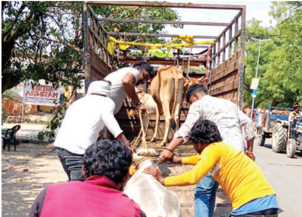
गोवर्धन परिक्रमा मार्ग से बेसहारा गोवंशी को पकड़ते कर्मचारी।