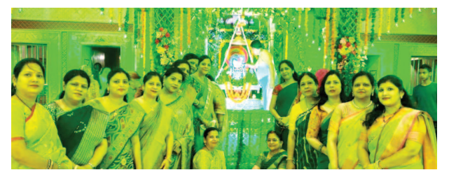
ठाकुर श्रीकेशव देव मंदिर में हरियाली तीज महोत्सव में खंडेलवाल महिला मंडल की महिलाएं।

यूनिक समय, मथुरा। प्राचीन मंदिर ठाकुर श्री केशव देव में खंडेलवाल महिला मंडल ने हरियाली तीज महोत्सव का आयोजन किया। महिलाओं ने भक्ति और संस्कृति का संगम प्रस्तुत किया।