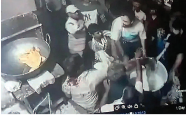
सीसी कैमरे में कैद मारपीट की घटना।

जब दुकानदार ने हरकत का विरोध करते हुए उन्हें शांत रहने को कहा, तो आरोपी युवक आग-बबूला हो गए। जबरन दुकान के काउंटर को पार कर अंदर घुस आए और दुकानदार पर