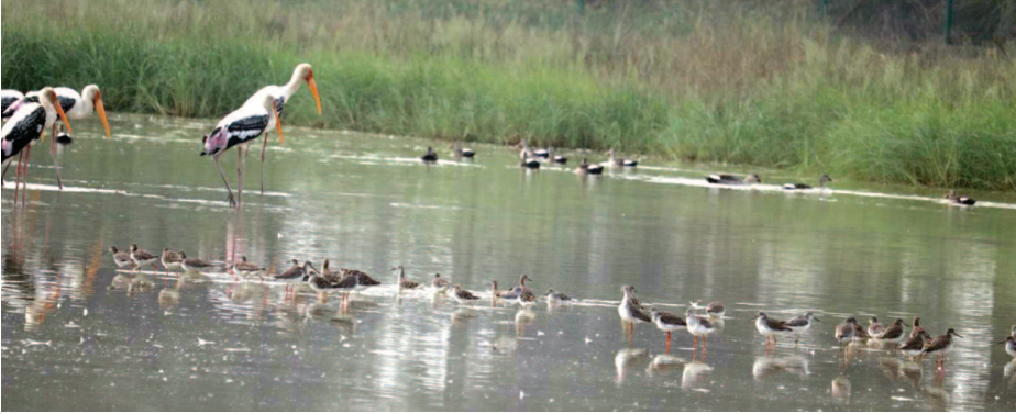
जोधपुर झाल में विचरण करते प्रवासी पक्षी।

यूनिक समय, मथुरा। सर्दियों में हजारों किलोमीटर की उड़ान भरकर ब्रज पहुंचने वाले कई प्रवासी पक्षी इस बार गर्मी के मौसम में भी जोधपुर झाल वेटलैंड में कलरब करते दिखाई दे रहे हैं। आमतौर पर अप्रैल के अंत तक अपने मूल प्रजनन स्थलों की ओर लौट जाने वाले ये पक्षी मई के अंतिम सप्ताह तक भी यहां मौजूद रहे, जिससे पक्षी