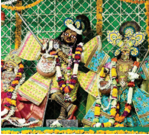
राधा दामोदर मंदिर में माखन चोर लीला की झांकी के दर्शन।

उत्सव के तहत मंदिर प्रांगण को विशेष रूप से रंग-बिरंगे फूलों, गुब्बारों और सुंदर वस्त्रों से सजाया गया था। ठाकुर राधा दामोदर जी का दिव्य श्रृंगार देख भक्त भावविभोर हो उठे। लीला के