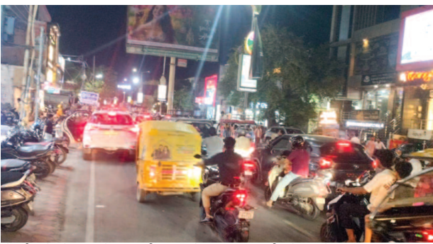
गोवर्धन चौराहे पर लगे जाम की वजह से कृष्णा नगर की ओर फंसे वाहन।

यूनिक समय, मथुरा। अराजक यातायात की वजह से लोगों की हर शाम जाम के नाम होती है। कृष्णानगर में लगने वाले जाम की वजह से लोगों का समय बर्बाद होता है, लेकिन जिम्मेदारों को इससे कोई फर्क नहीं पड़ता है। शहर से घर और दूसरे काम से गोवर्धन चौराहे की ओर जाने वालों को जाम की वजह से आधे से पौन घंटा बर्बाद करना पड़ता है। यातायात के रेंग-रेंगकर चलने की वजह से वाहनों का ईंधन भी व्यर्थ बर्बाद होता है।