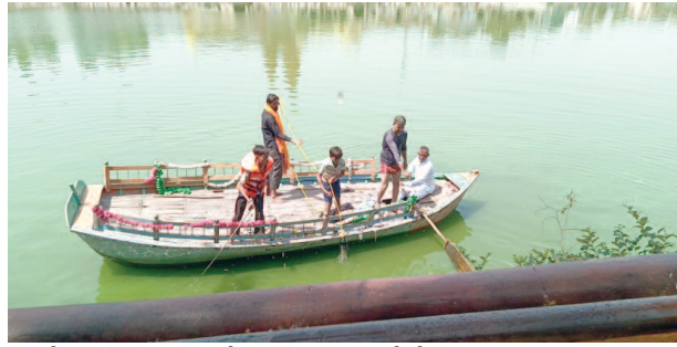
मानसी गंगा में डूबे किशोर की नाव से तलाश करती टीम।