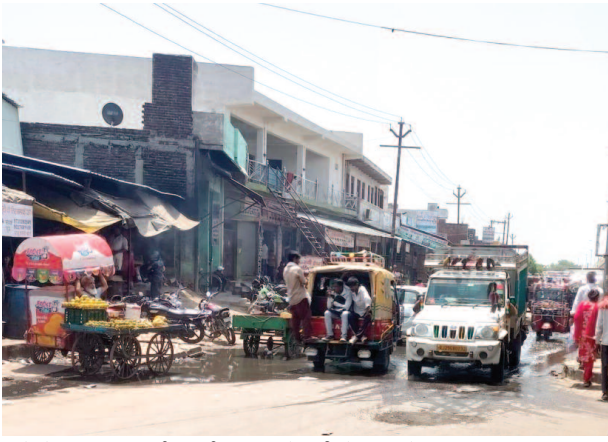
नाले से निकलकर सर्विस मार्ग पर भरे गंदे पानी से निकलते वाहन।

कस्बा के समीप से निकल रहे राष्ट्रीय राजमार्ग का सर्विस रोड इन दिनों बंद है। एक ओर के सर्विस रोड के सहारे बने नालों में दुकानदारों की गंदगी और पानी भरा हुआ है, जबकि एक ओर के नाले में कस्बा के घरों से से आने वाला पानी गिर रहा है। अब सफाई के अभाव में दोनों ओर के नाले गंदगी और कचरे से ठसाठस भरे हुए हैं, जिससे गंदा पानी नालों से निकलकर सर्विस रोड पर भरने लगा है। अंडरपास