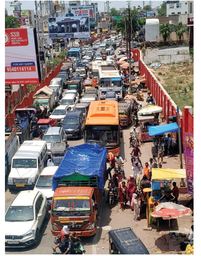
गोवर्धन की ओर से आने वाले वाहनों की वजह से गोवर्धन चौराहे पर लगा जाम।

परिक्रमार्थियों को प्रसाद के पैकेट बांटते मथुरा रॉयल ग्रुप के पदाधिकारी।