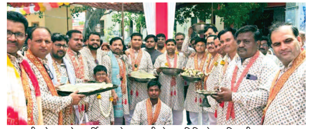
राधारानी को 56 भोग अर्पित करते राधारानी सेवा समिति के पदाधिकारी।