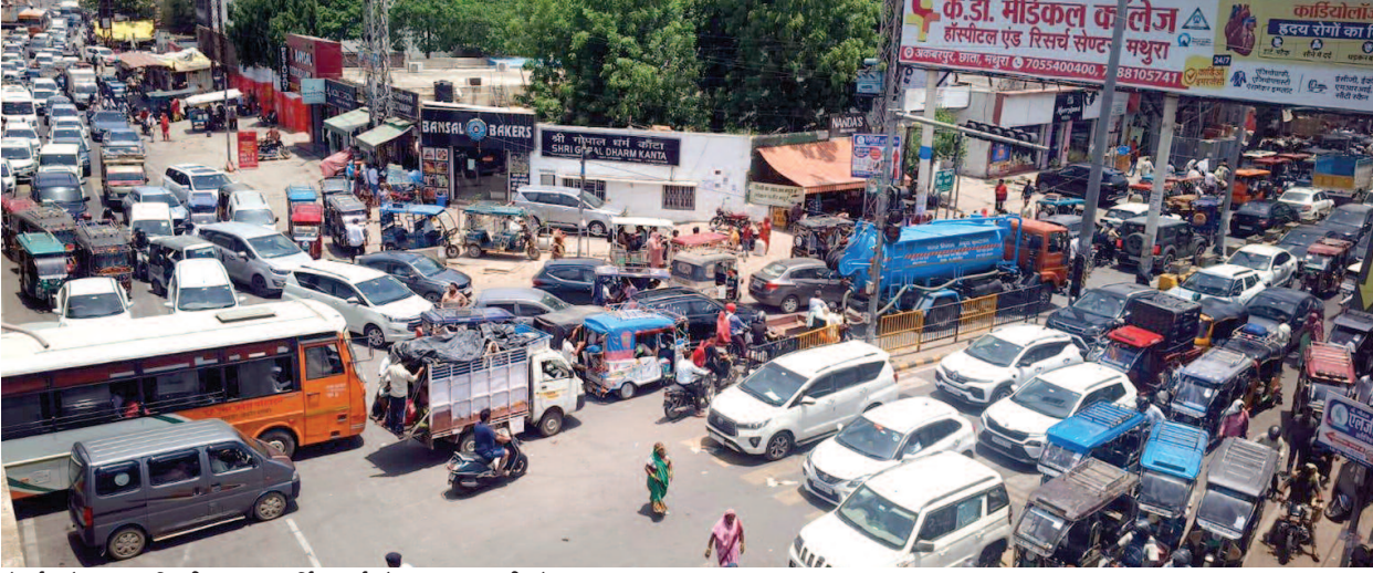
गोवर्धन चौराहा पर दिल्ली-आगरा सर्विस मार्ग और कृष्णानगर की ओर लगा जाम।