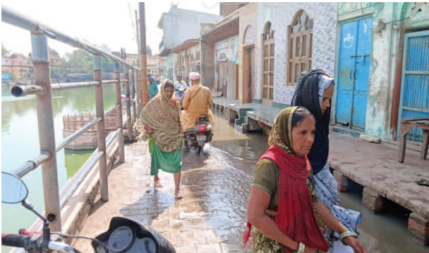
मानसी गंगा मार्ग से पानी में होकर परिक्रमा देते श्रद्धालु।

हाल के दिनों में मानसी गंगा में डूबने की चार घटनाओं के बाद प्रशासन ने घाटों पर बैरिकेडिंग और फव्वारे लगाने की व्यवस्था की है, लेकिन इसके बावजूद हालात सुधरते दिखाई नहीं दे रहे हैं। कई घाटों पर अब भी पर्याप्त बैरिकेडिंग नहीं की गई है। रविवार को