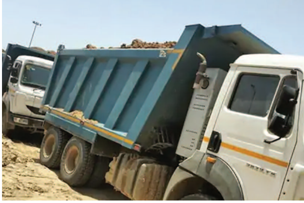
पुलिस को जानकारी मिली थी कि क्षेत्र से ओवरलोड डंपर गुजरने वाले हैं।

यूनिक समय, आगरा। एत्मादपुर क्षेत्र में पुलिस ने अवैध खनन के खिलाफ सख्त कार्रवाई करते हुए दो ओवरलोड डंपर जब्त किए हैं। यह कार्रवाई छलेसर चौकी क्षेत्र में की गई, जहां सूचना के आधार पर पुलिस टीम ने घेराबंदी कर दोनों वाहनों को मौके से पकड़ लिया। सूत्रों के अनुसार, मिट्टी से लदे ये दोनों डंपर बिना वैध अनुमति के संचालित किए जा रहे थे। बताया जा रहा है कि कुछ लोग विकास प्राधिकरण के नाम का दुरुपयोग कर खाली प्लॉट में अवैध रूप से मिट्टी भराई का काम कर रहे थे। इसी सूचना के बाद पुलिस सक्रिय हुई और पूरे इलाके में निगरानी बढ़ा दी गई।