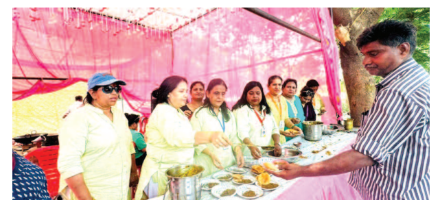
मिशन स्मार्टल फाउंडेशन समिति के भंडारे से प्रसाद लेते श्रद्धालु।