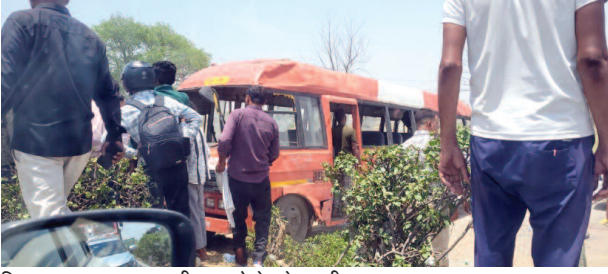
डिवाइडर पर चढ़कर पलटी बस को देखते राहगीर।

यूनिक समय, फरह। सोमवार दोपहर रोडवेज की एक अनुबंधित बस ओवरटेक के फेर में पलट गई। पलटा खाने के बाद बस डिवाइडर पर चढ़कर सीधी हो गई। हाइसे में दो महिला यात्रियों की मौत हो गई, जबकि एक दर्जन यात्री घायल हो गए। घायल यात्रियों को स्थानीय सीएचसी के अलावा अन्य अस्पतालों में भर्ती कराया गया। यात्रियों ने चालक पर शराब पीकर बस चलाने का आरोप लगाया है।