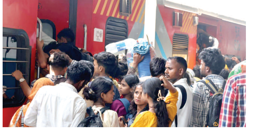
जंक्शन पर ट्रेन में चढ़ने को जदोजहद करते परीक्षार्थी।

पुलिस भर्ती परीक्षा को आए अभ्यर्थियों ने बताई दिल की बात