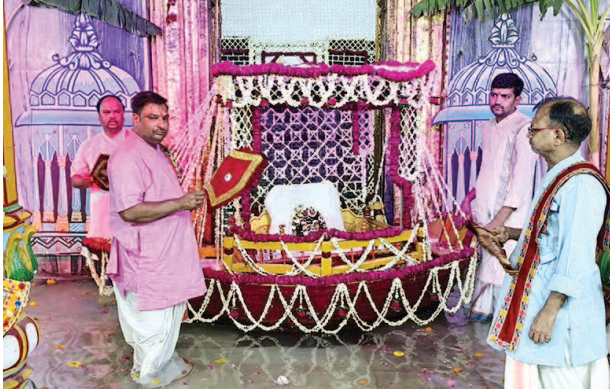
नौका विहार दर्शन के दौरान भगवान द्वारकाधीश।

यूनिक समय, मथुरा। सोमवार को द्वारकाधीश मंदिर में श्रद्धालुओं को नौका विहार के दर्शन हुए तो मंदिर जयकारों से गुंज उठा। श्रद्धालु भी भगवान की छवि को निहारते रहे। मंदिर ठाकुर द्वारकाधीश के विधि