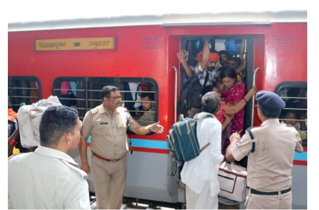
ट्रेन में यात्रियों को बैठाते आरपीएफ पुलिस की टीम।

परीक्षा अभ्यर्थी और श्रद्धालु एक साथ पहुंचे