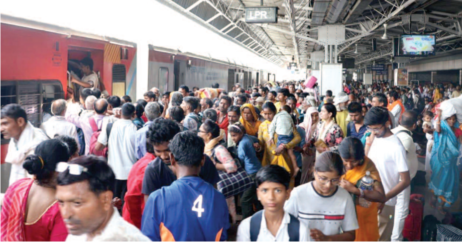
सोमवार को मथुरा जंक्शन पर मौजूद यात्री।