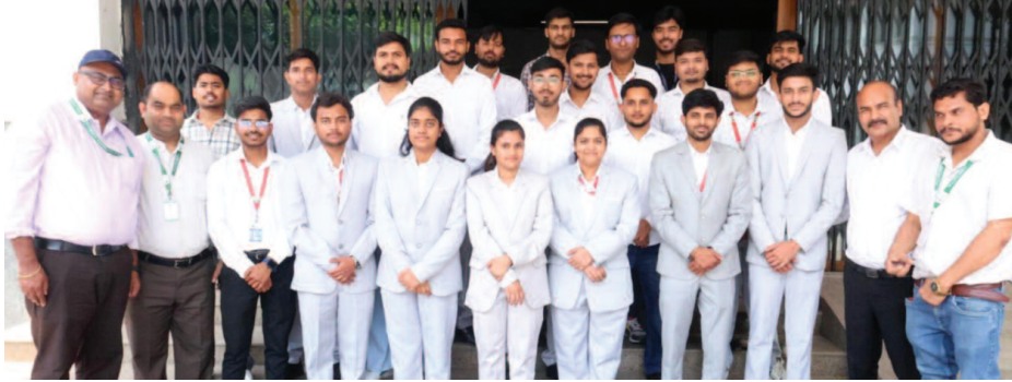
जीएलए विश्वविद्यालय के इलेक्ट्रॉनिक्स एंड कम्प्यूटेशन इंजीनियरिंग के चयनित छात्र-छात्राएं।

शैक्षणिक सत्र 2025-26 के कैंपस प्लेसमेंट अभियान के दौरान देश और विदेश की अनेक प्रतिष्ठित कंपनियों ने विभाग के विद्यार्थियों को रोजगार के अवसर प्रदान किए। इनमें एक्सचेंजर, कॉग्निजेंट, एम्बर एंटरप्राइजेज इंडिया, बाको, वैलिंग्स सॉल्यूशंस, एनएक्सपी सेमीकंडक्टर, वीवो इंडिया, इनक्रीफ, सिलिकॉन लैब्स तथा स्पाक मिंडा जैसी अग्रणी कंपनियां शामिल रही। इन कंपनियों ने विद्यार्थियों के तकनीकी ज्ञान, विश्लेषणात्मक क्षमता, संचार कौशल, नवाचार सोच, समस्या समाधान योग्यता