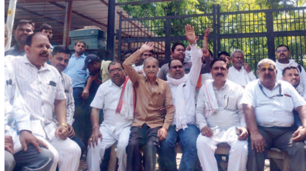
फ्रंट ऑफिस सिस्टम के विरोध में हड़ताल पर बैठक कातिब आदि।

प्रदेश सरकार द्वारा उपनिबंधन कार्यालयों में पीपीपी मॉडल पर फ्रंट ऑफिस सिस्टम लागू किया जा रहा है। इसके विरोध में सोमवार को सदर तहसील के उप निबंधन कार्यालय में