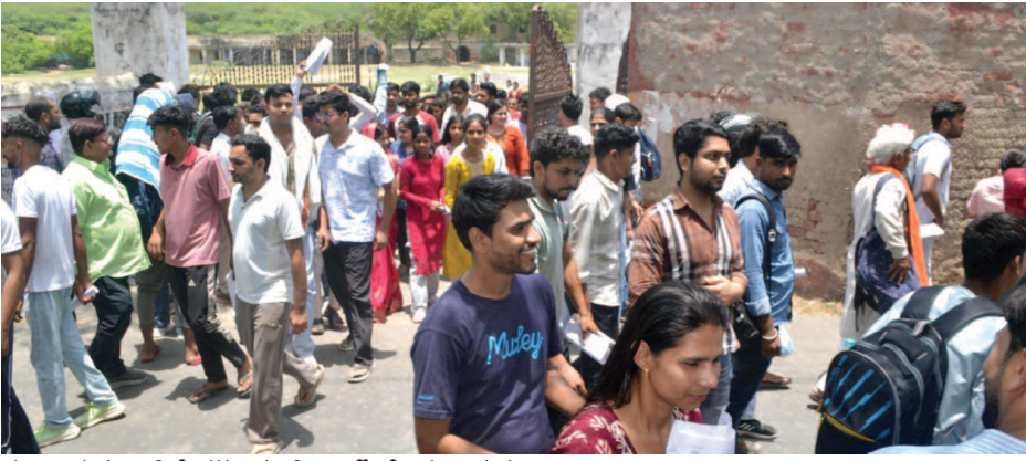
सोमवार को केआर डिग्री कॉलेज से पुलिस भर्ती परीक्षा देकर लौटते छात्र-छात्राएं।

परिवार के सपनों बेरोजगारी की चुनौती और वर्दी की है इच्छा सरकारी नौकरी की उम्मीद लेकर मथुरा पहुंचे हजारों अभ्यर्थी